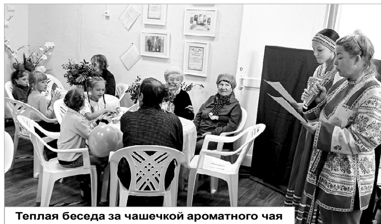
Теплая беседа за чашечкой ароматного чая