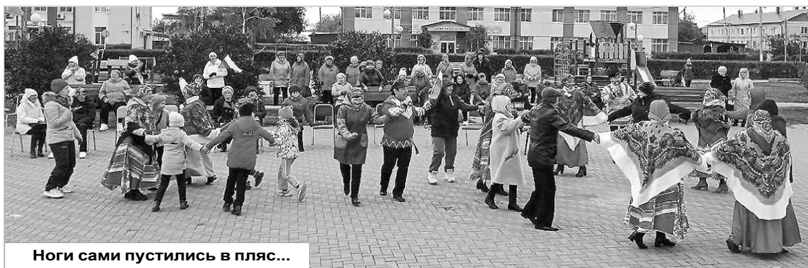
Ноги сами пустились в пляс...