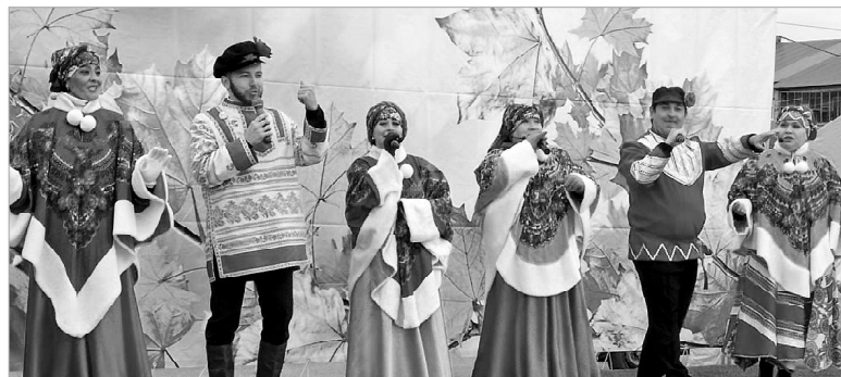
Музыкальный подарок людям элегантного возраста