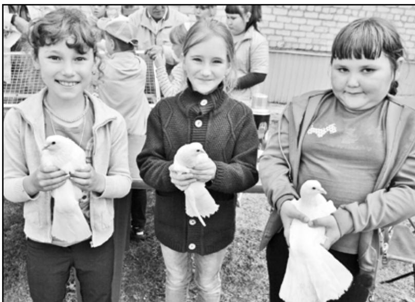
Ещё минута – и голуби будут выпущены в небо