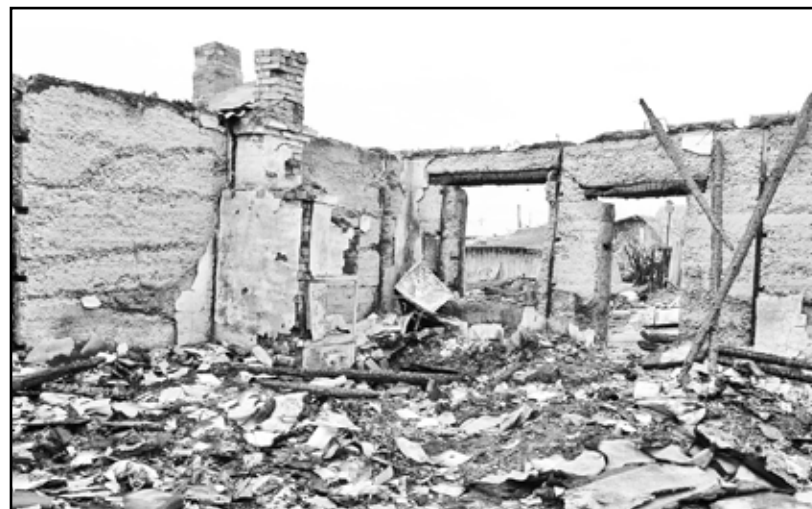
Вот всё, что осталось от жилого дома в селе Яровском после пожара, возникшего из-за неосторожного обращения с огнём

Пожары не возникают сами по себе, как правило, они следствие вины самого человека. Будьте пре-