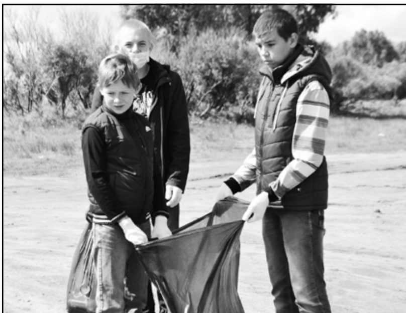
На очистку берега реки вышли с большими пакетами для мусора

и отпускать этих ручных птиц, каждый желающий получил в руки красивого белого голубя. По команде (практически одновременно) птицы были выпущены в небо. Пролетев над школой, они повернули к себе домой. Ах, если бы можно было передать словами всё счастье, ликование и радость детей!