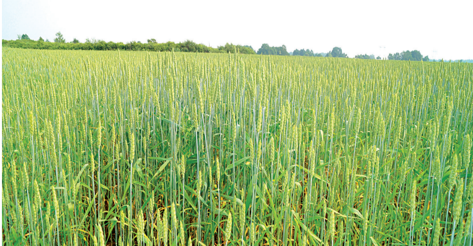
На полях Даниловых зерновые отменные

О предстоящей жатве говорить ещё рано. Однако, по расчётам агронома, видовая урожайность на полях кутарбитского сельхозпредприятия, где мы побывали, в среднем составляет не менее тридцати центнера зерна с гектара по кругу.