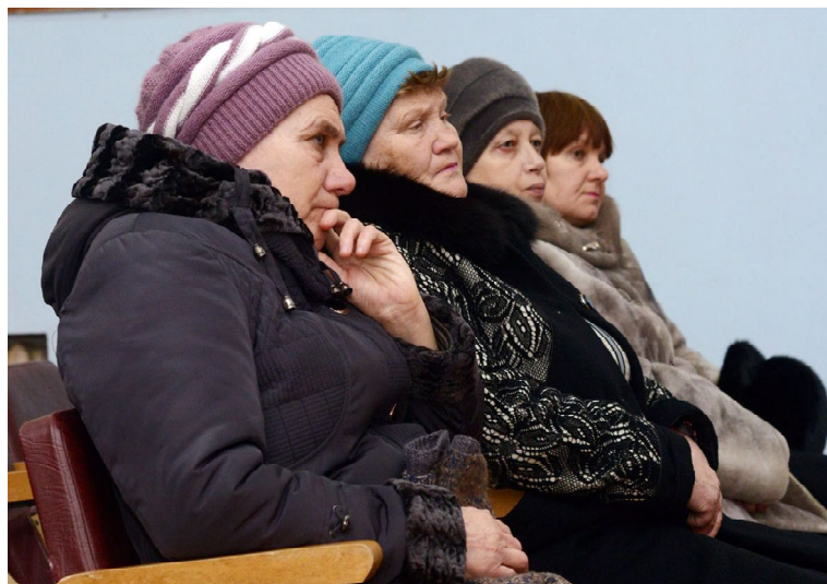
Несмотря на мороз, шабановцы пришли на встречу в сельский Дом культуры