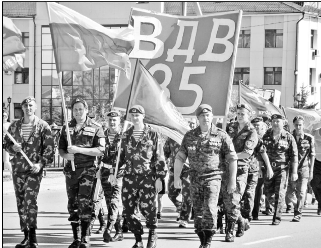
Торжественным маршем прошли ветераны-десантники от здания Казанской сельской администрации (где находится штаб-квартира организации «Патриот») до памятника Солдату и Матросу

казарме. В небо были запущены гелевые шарики, в след за которыми вспорхнули ввысь белоснежные голуби.