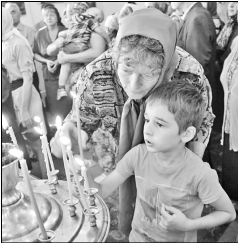
Детские впечатления о красоте богослужения – одни из самых живучих

Даже до сих пор редко кто в сельской местности работает в этот день: уважают память столь серьёзного пророка. В Ильинке