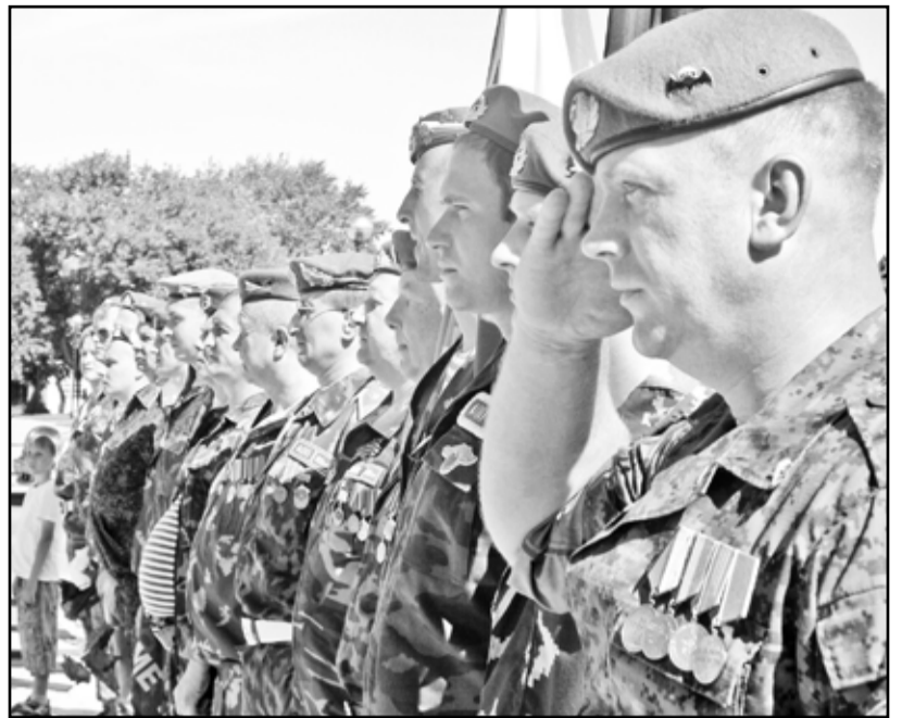
Среди ветеранов службы в ВДВ – активисты-общественники и профессионалы в своём деле. Равнение на них!

Самым проникновенным моментом мероприятия стала акция в память о 24-х десанниках, погибших в омской