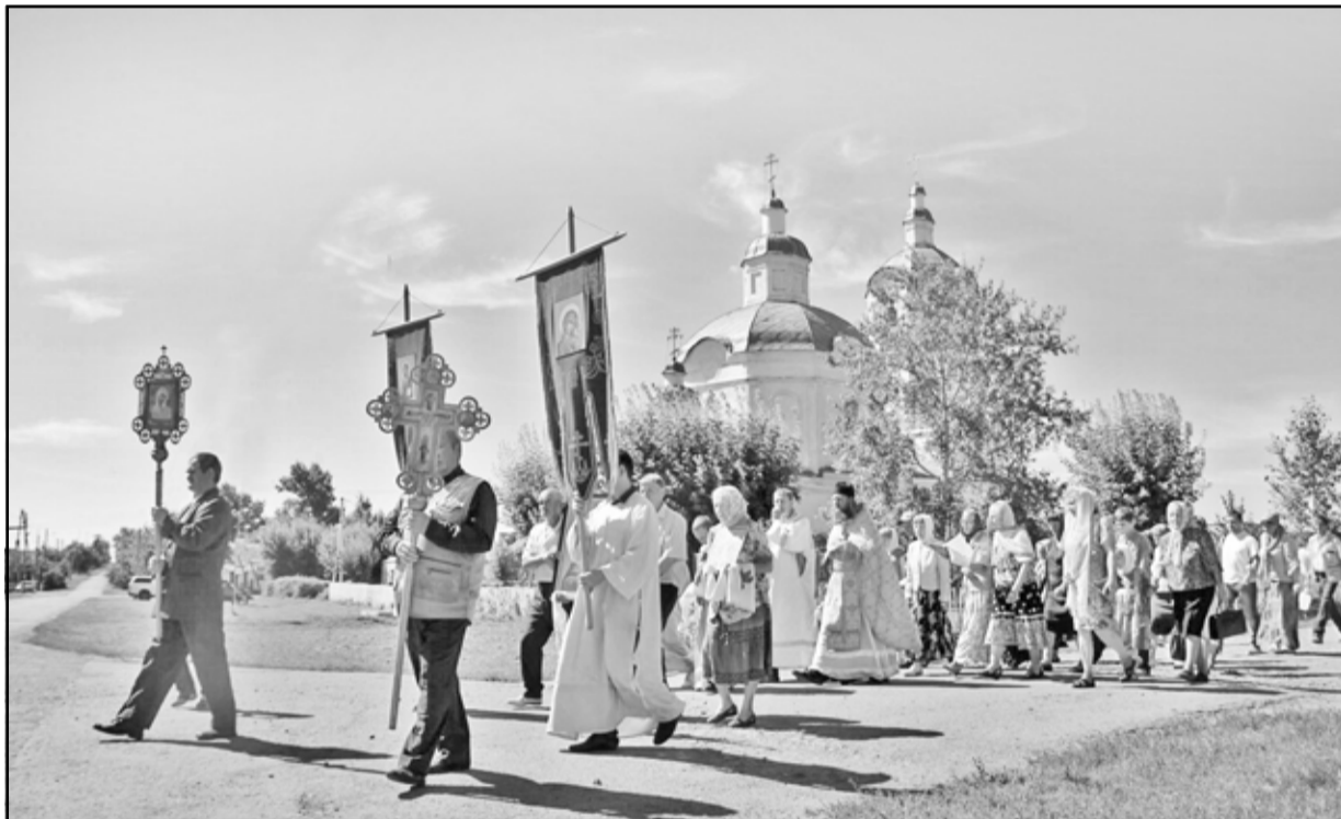
И Ильинке живёт многолетняя традиция совершать праздничный крестный ход по селу