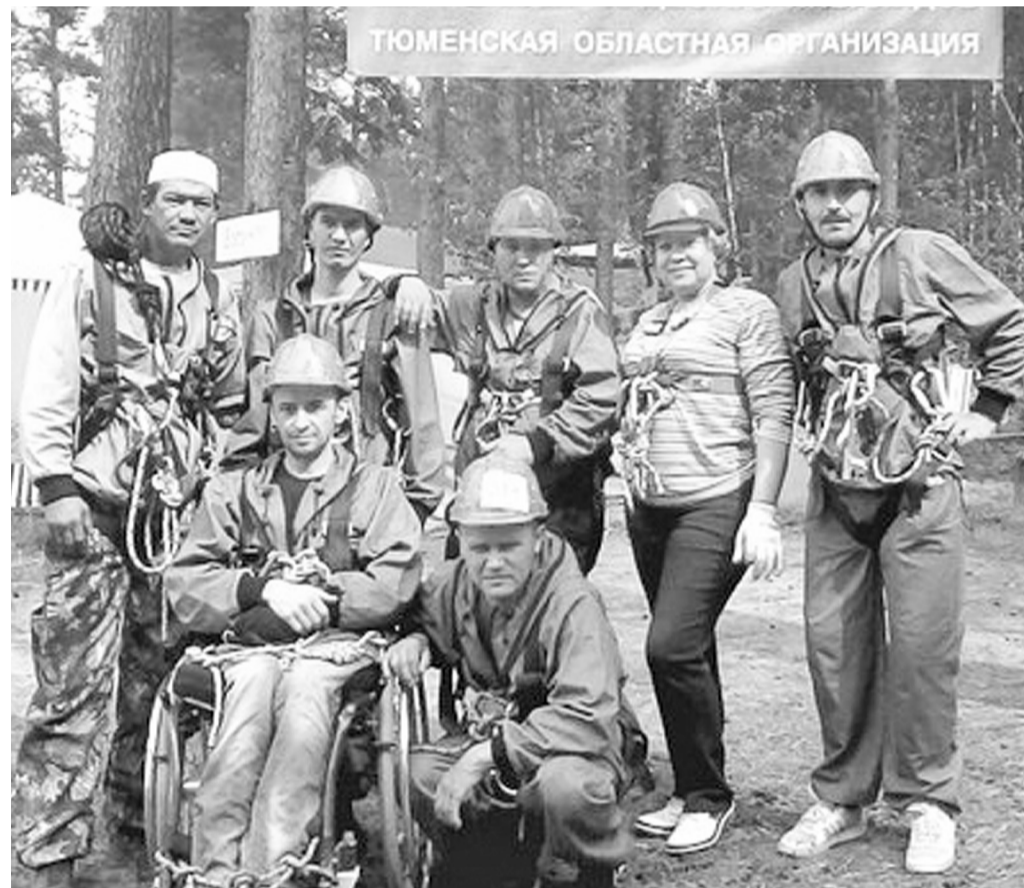
Команда «Синяя птица».

Не просто каждый раз ждут, а мечтают снова и снова окунуться в эти, как кому-то может показаться, нечеловеческие условия существования (почти недельное проживание в лесу, ночёвка в палатке, готовка пищи на костре, изнурительные спортивные дистанции на воде, склонах, лесных тропях).