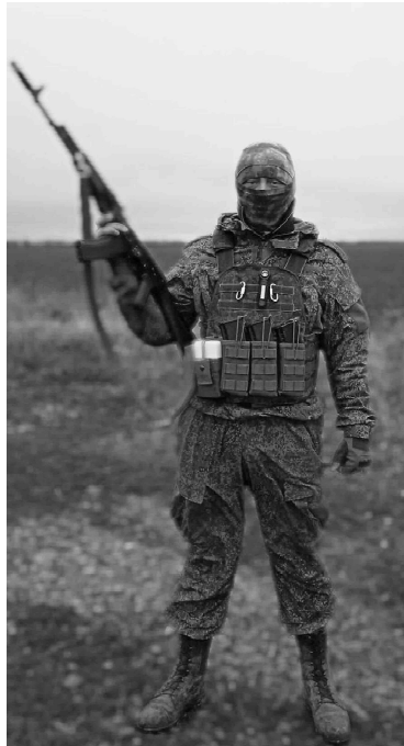
Рядовым «Маэстро» гордятся земляки