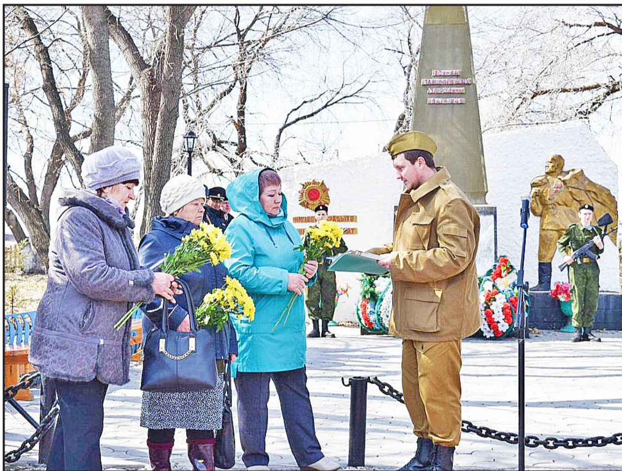
Вручение документов родственникам погибшего