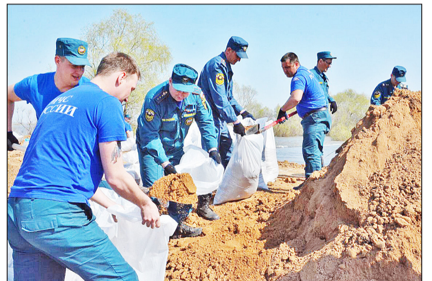
Сотрудники аэромобильной группы главного управления МЧС России по Тюменской области делают оперативный запас мешков с грунтом

Всё возможное делается, чтобы облегчить жизнь людям в сложившейся ситуации. Составлен разо-