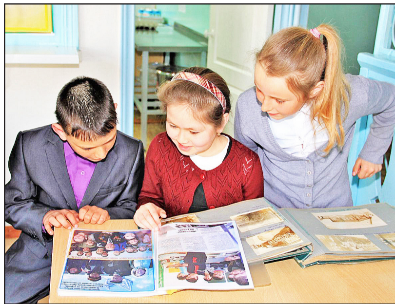
Маленькие чирковцы с интересом разглядывают школьные альбомы, посвящённые ветеранам войны

«Катюши», разнокалиберные пушки. Когда мы начинали брать высоту – земля тряслась. Без перерыва шли до границы, до Кёнигсберга. Он был очень сильно укреплён. Бетонированные бункера образовали целый подземный город. Взяти мы и его, прижав противника к морю». В апреле 1945 года Кёнигсберг был взят. Измученным походами солдатам дали отдых. Расположились в лесу. Как-то ночью внезапно раздался сигнал тревоги, все повыскакивали из своих палаток. В эту ночь им объявили одну из счастливейших новостей за последние месяцы: «Победа!» От радости артиллеристы открыли стрельбу. Это был их первый Праздник Победы.