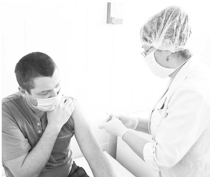
Вакцинация проводится в рабочее время.