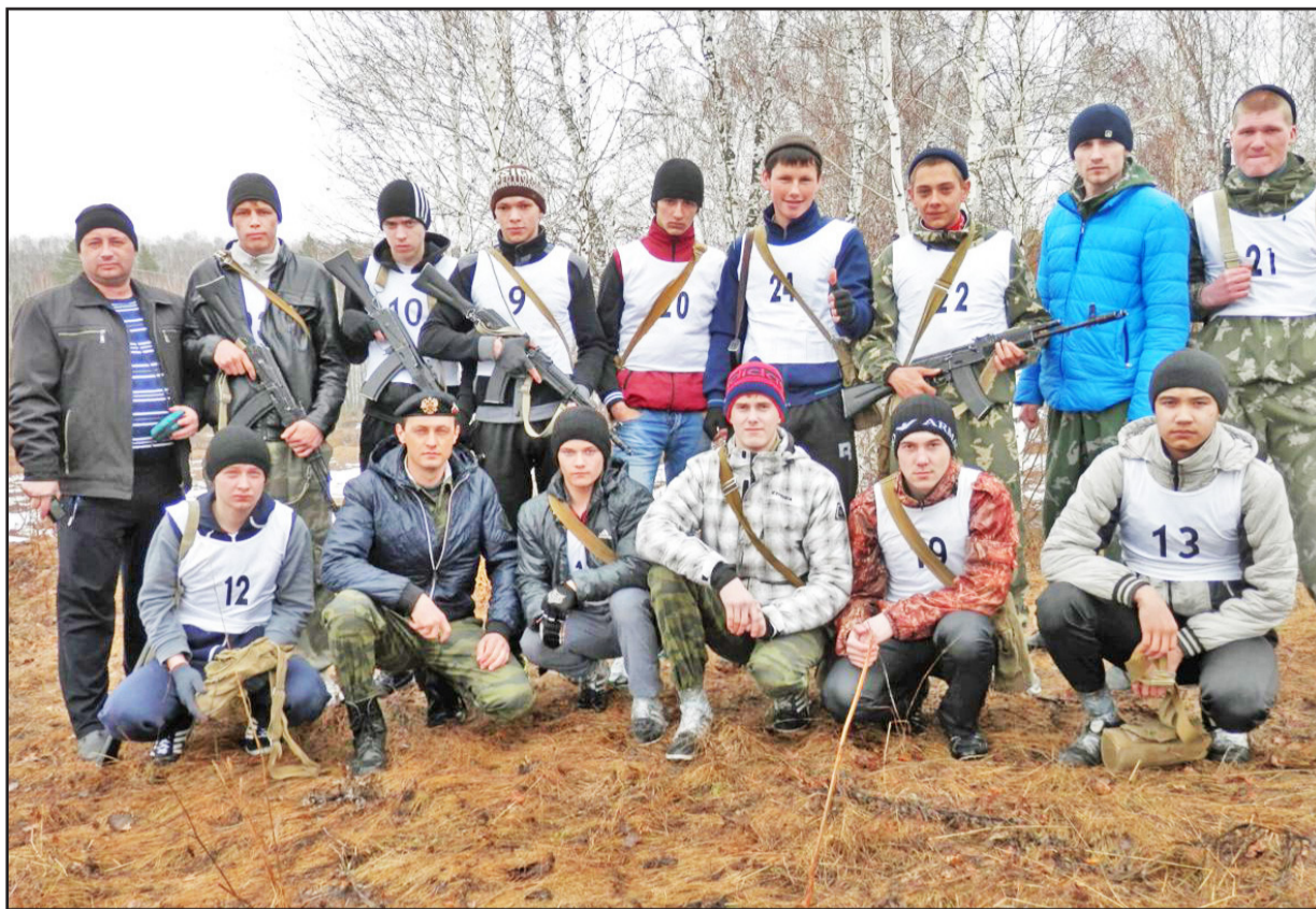
Команда Казанского района перед испытаниями

Перед самым финишем юношам, облачённым в противогазы, пришлось преодолеть зону задымления. К финишу они пришли мокрые, измотанные, обрызганные грязью с ног до головы. Но расслабляться было нельзя. Силы требовались ещё для выполнения акробатических упражнений: нужно было перепрыгнуть с автоматом через препятствие, при этом выполнить кувырок через голову, а потом принять положение для стрельбы с колена. Немало выносливости требовалось парням при совершении 10 кувырков с автоматом вперёд и назад. И это ещё не всё. Следующим этапом была стрельба из пневматического пистолета по трём мишеням с расстояния 10 метров с разных огневых рубежей. Во время спарринга (тренировочного боя) молодым людям, сдававшим экза-