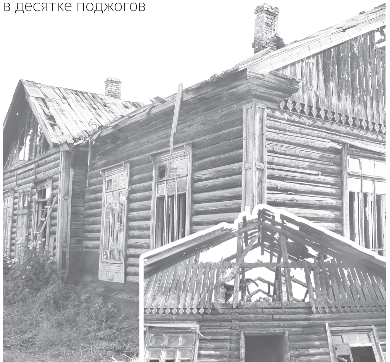
Деревянный многоквартирник по Первомайской, 50 за лето несколько раз подвергался «набегам» поджигателей

Полицейские задержали подозреваемого в десятке поджогов