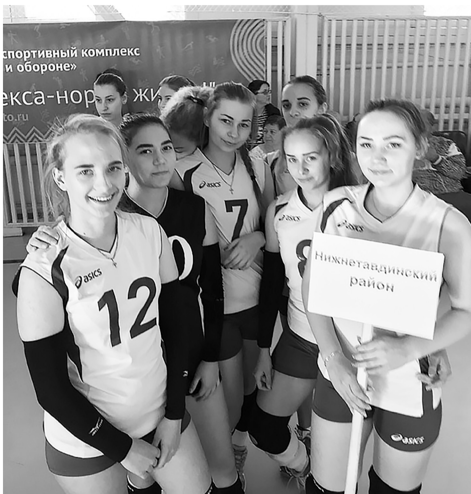
Отличный старт нижнетавдинских волейболисток во второй лиге: четыре матча – четыре победы.

26-28 октября в Тобольске прошли соревнования по волейболу среди девочек 2007-2008 годов рождения в рамках Детской волейбольной лиги. Приняло участие двенадцать команд. Наш