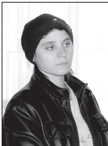
О проблемах – из уст жителей