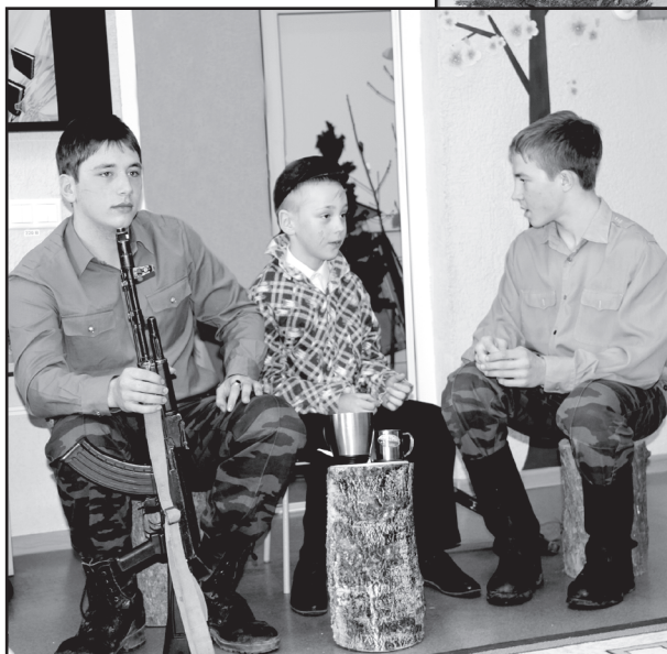
По страницам любимых книг

Проведение Недели детской и юношеской книги – традиция Детской библиотеки с давних пор. Я пришла на работу в качестве заведующей в 1991 году и ежегодно совместно с отделом образования мы организовывали слёт юных книголюбов. Я понимала, что форма проведения слёта несколько устарела. Хотелось отойти от заорганизованности, идеологической составляющей. Необходимо было вносить инновационные идеи по популяризации книги, чтения. И в 1993 году Детская библиотека впервые провела районный литературный праздник «На балу у королевы Книги». Здесь были костюмы, музыкально-танцевальные сценки, театрализации. А самое главное – новая интересная идея: показать привлекательность творческого чтения. Прочитай книгу – пофантазируй! Умеешь рисовать – рисуй, пет – пой, танцевать – танцуй. Это было грандиозное зрелище. Новое, необычное, интересное. Далее последовали «Пиратские страсти», ведь дети увлекались чтением морских приключений, семейные праздники, конкурсы для дошколят и многое другое. Кстати, традиция поддерживалась школьными библиотеками, а сельские библиотекари не принимали участие в моих праздниках. Единственным минусом был тот факт, что мероприятия приходилось проводить вне стен библиотеки. Не было у