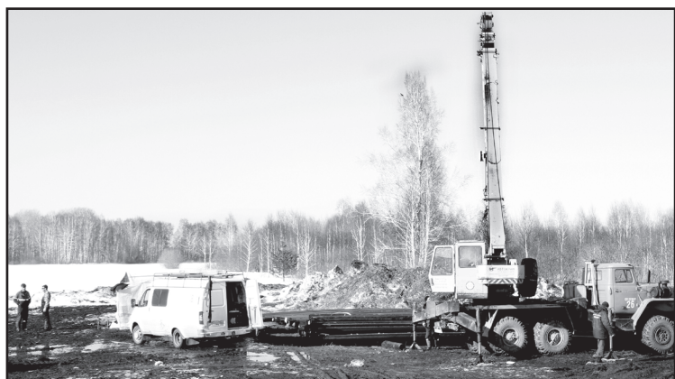
Строится новая ветка газопровода