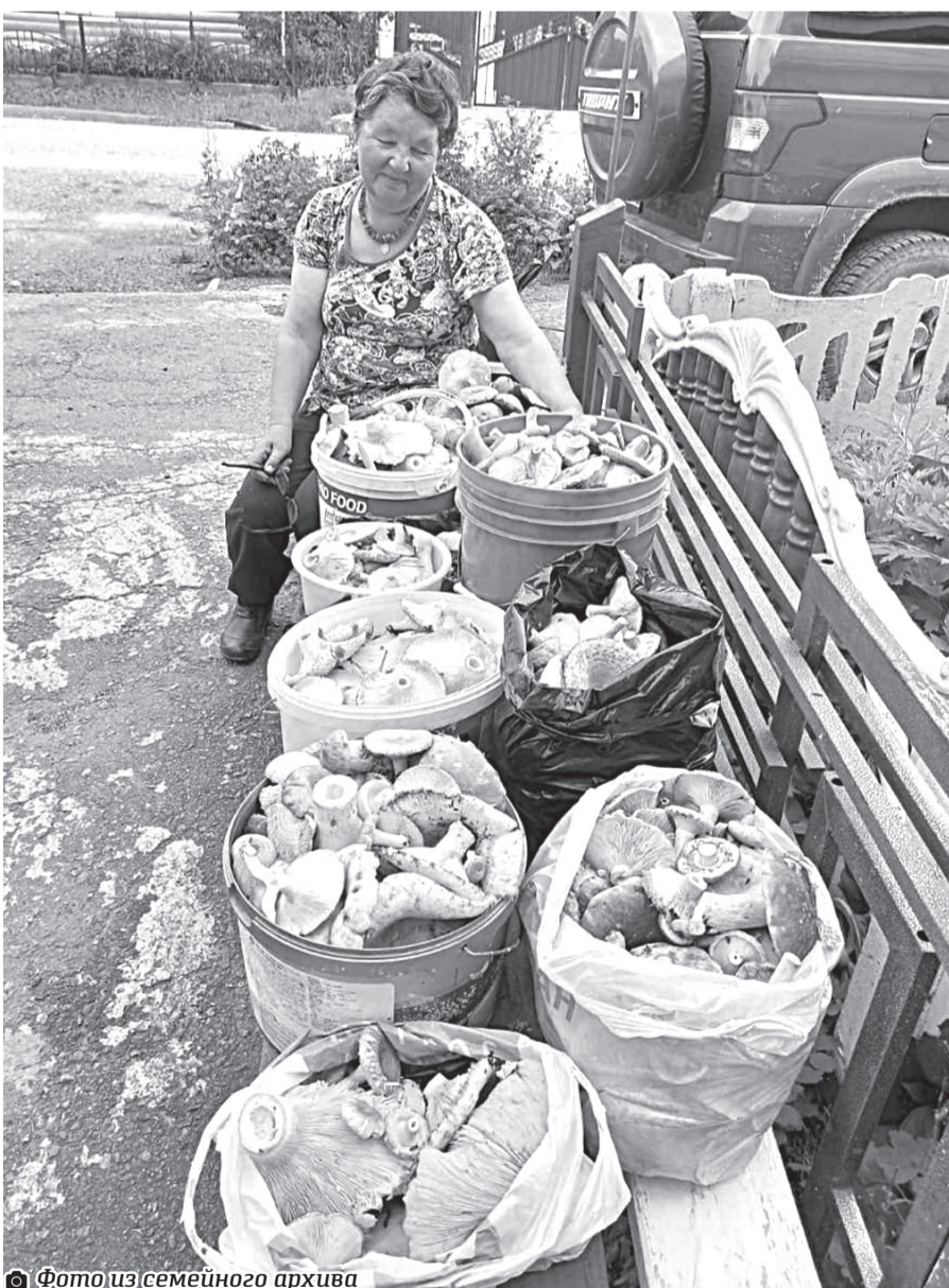
✎ Фото из семейного архива