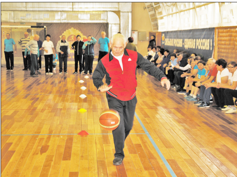
Кто ловко бьёт по мячу, тому всё по плечу