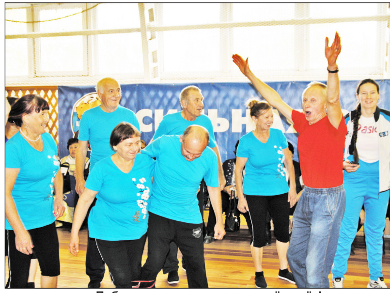
Побеждает тот, кто смело вперёд идёт! Новоселезнёвцы стали победителями спартакиады