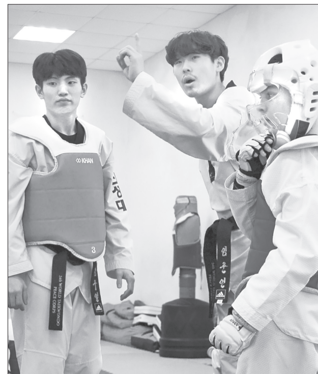
Под руководством корейских мастеров ялуторовские воспитанники оттачивали базовые приемы тхэквондо