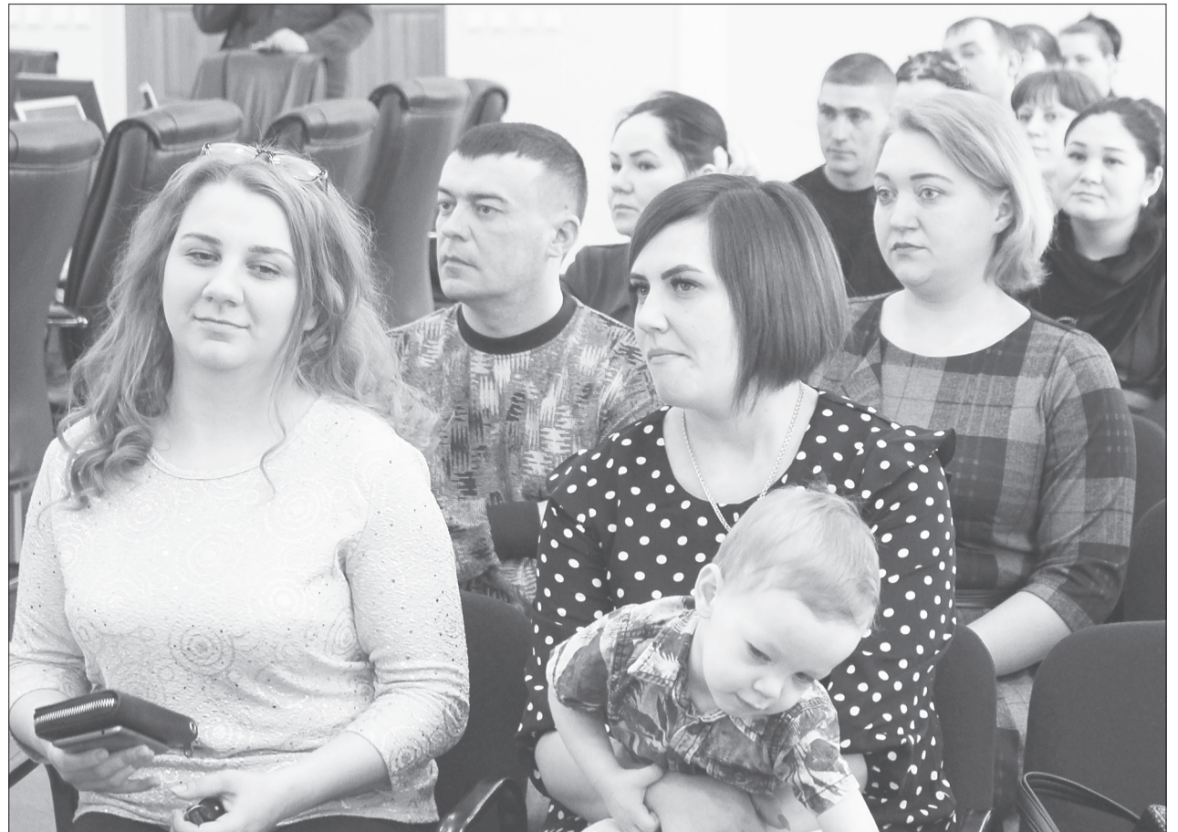
Семьи, получившие свидетельства, могут рассчитывать на социальную выплату в зависимости от своего состава

93% Никакая территория РФ не может быть отчуждена