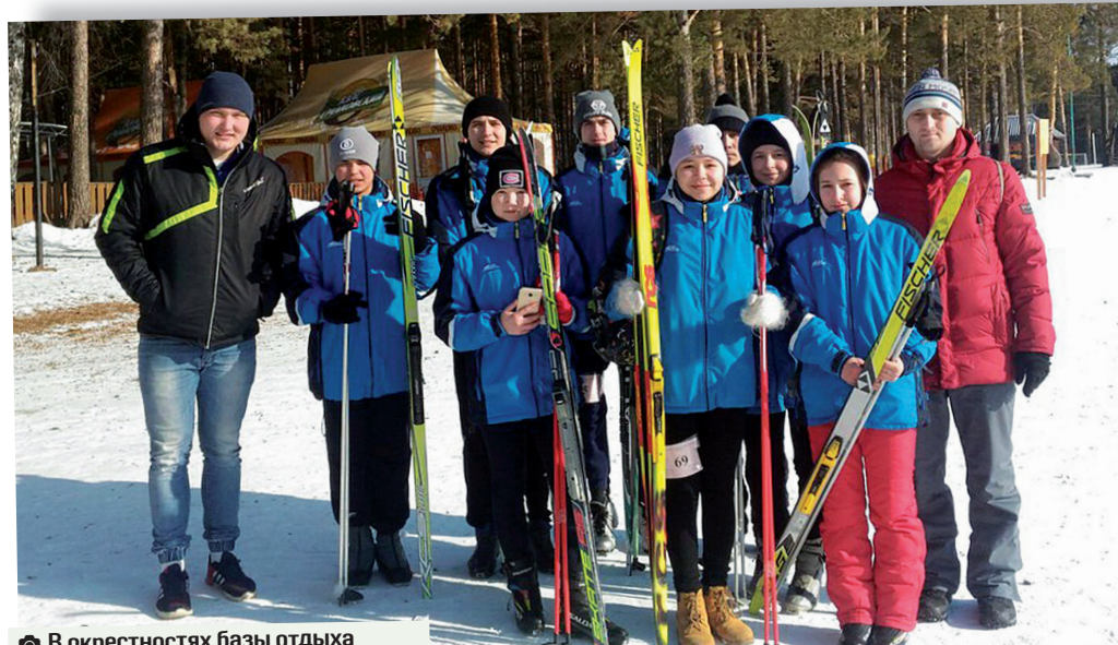
В окрестностях базы отдыха «Пруд лесной» не утихла упорная борьба на дистанциях по спортивному ориентированию

Здесь ребят ждал матч с футболистами Куть-Яха, которые были решительно настроены выйти в финал турнира. Поэтому сельчанам пришлось изрядно попотеть и проявить весь свой арсенал действий. Первый тайм закончился для нашей команды с неутешительным счётом 2:1, гости дважды поразили наши ворота. Игра кардинально поменялась во втором тайме, где наши спортсмены, собрав волю и силу, перешли в атаку. Теперь соперник вынужден был обороняться всей командой. После эффективных розыгрышей селян оборона про-