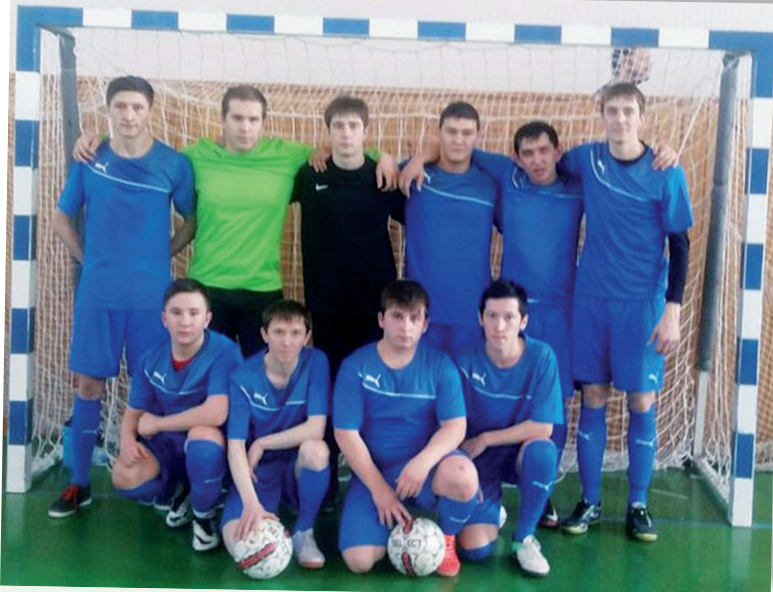
Команда Тобольского района вышла на 2 место по мини-футболу

личном зачёте по сумме всех испытаний он занял третье место! В общекмандном зачёте наши спортсмены занимают 10 позицию из 25 – есть чем гордиться!