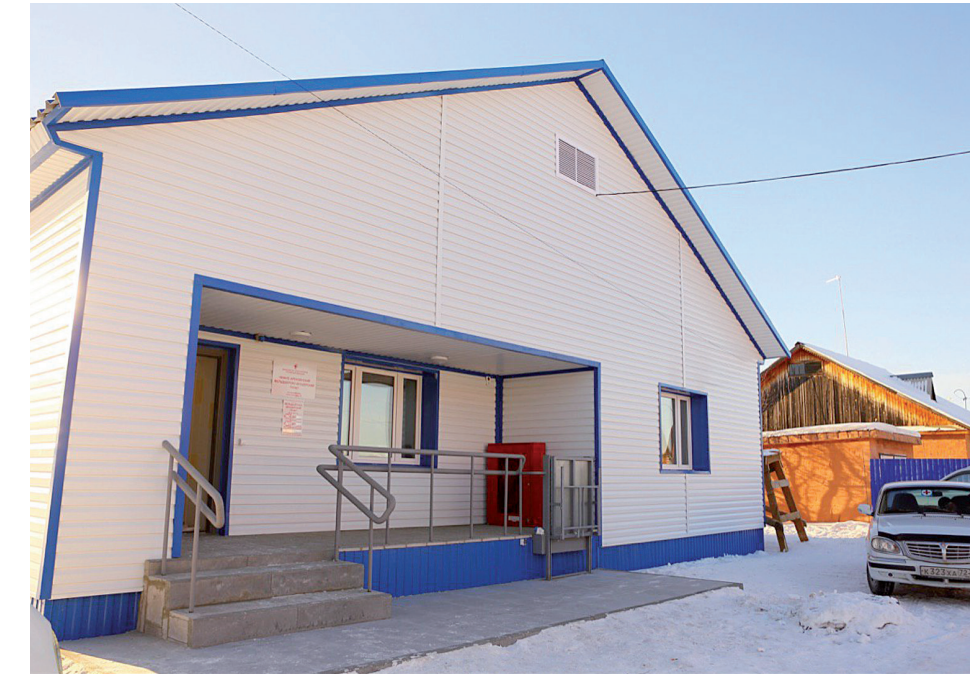
Новый ФАП в Нижних Аремзянах

Население Тобольского района, по данным медицинской статистики, составляет 20 509 человек, из них 16 612 человек – взрослое население (11 025 – лица трудоспособного возраста, 5 587 человек – старше трудоспособного возраста). Детское население – 3 897 человек.