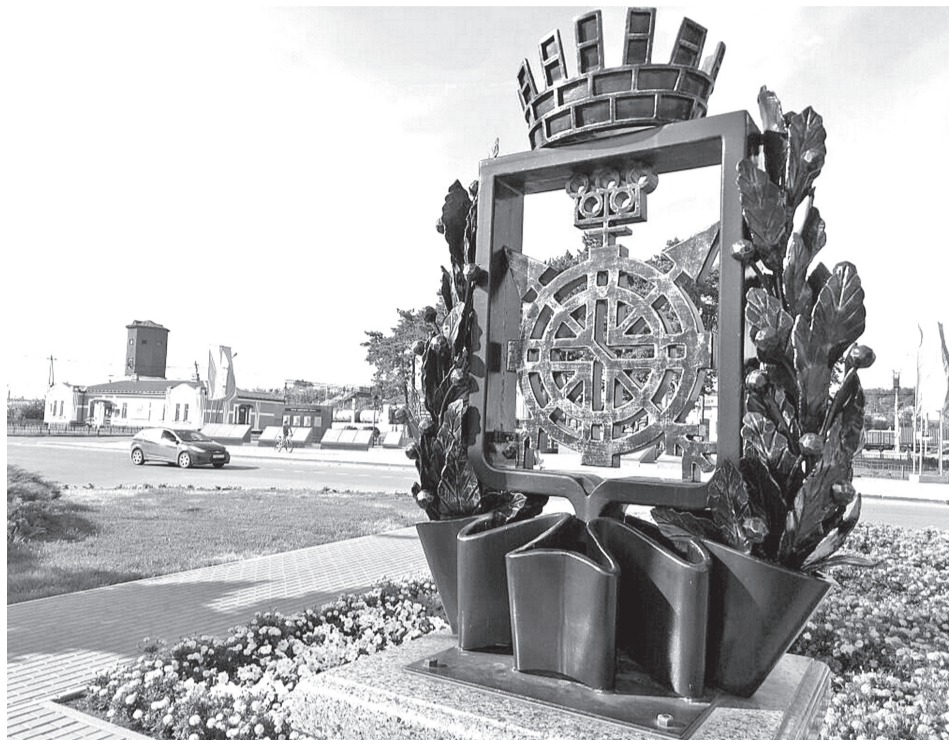
• Три столетия истории земли Заводоуковской нашли отражение в гербе нашего городского округа.

Символика принятого в 2005 году герба хорошо известна многим любителям истории нашего края. Скрещенные стрелы (по-