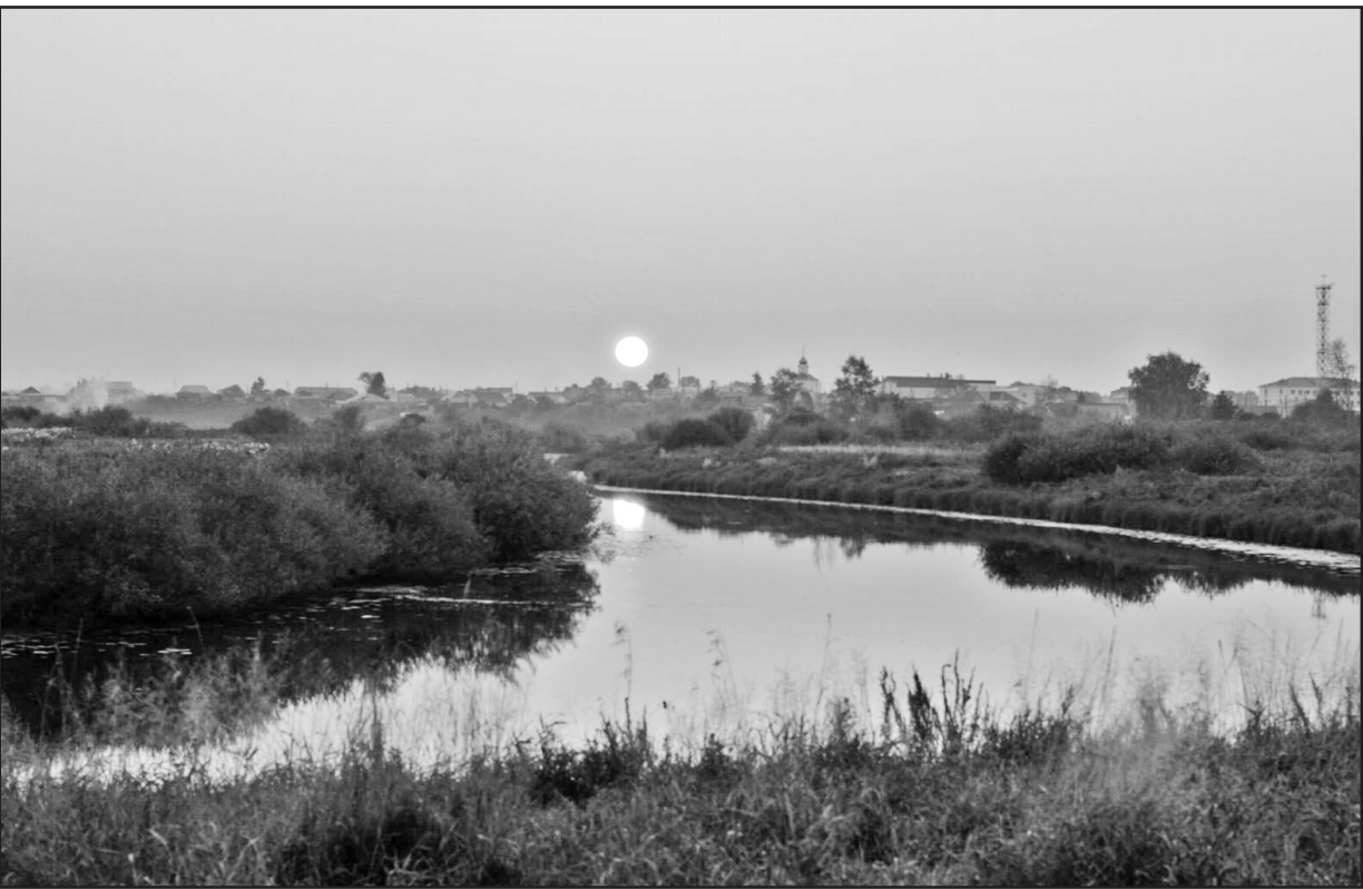
Осенний день угасает

Для читателей, которые с ностальгией вспоминают прожитые годы, представляем серию книг «Сделано в СССР». Серия эта, в свою очередь, состоит из двух подсерий: «Любимая проза» и «Народная эпопея». В них представлены наиболее важные и популярные