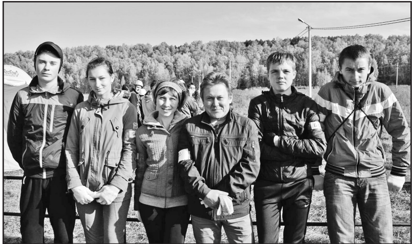
Команда Большеярковской школы – победитель районных соревнований в группе В