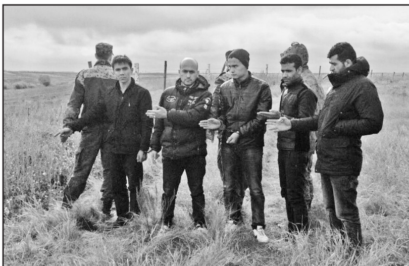
Фото предоставлено пресс-службой Пограничного управления ФСБ России по Курганской и Тюменской областям

Пресс-служба Пограничного управления ФСБ России по Курганской и Тюменской областям