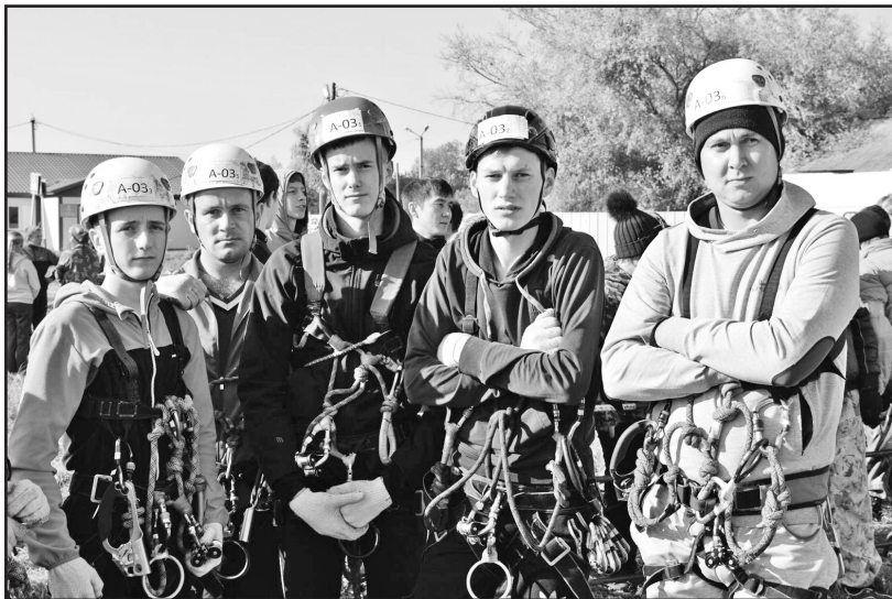
Ильинская команда – победитель районных соревнований в группе А

В этом году к прохождению дистанции организаторы добавили конкурсную программу, которая оценивалась отдельно и не входила в общий зачёт. Творческая группа должна была выпустить газету, в которой нужно было сделать репортаж о соревнованиях или написать туристическую биографию команды.