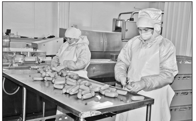
В упаковочном цехе

Не буду утомлять читателя рассказом о том, как делают колбасу. Скажу лишь, что особое вни-