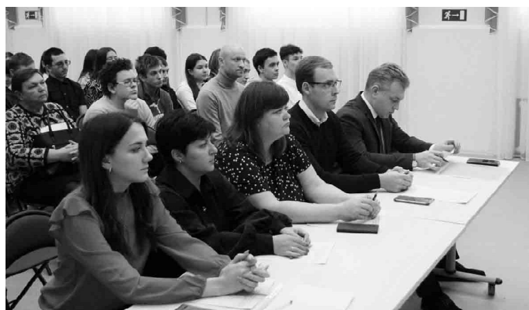
Компетентное жюри оценило презентации ребят