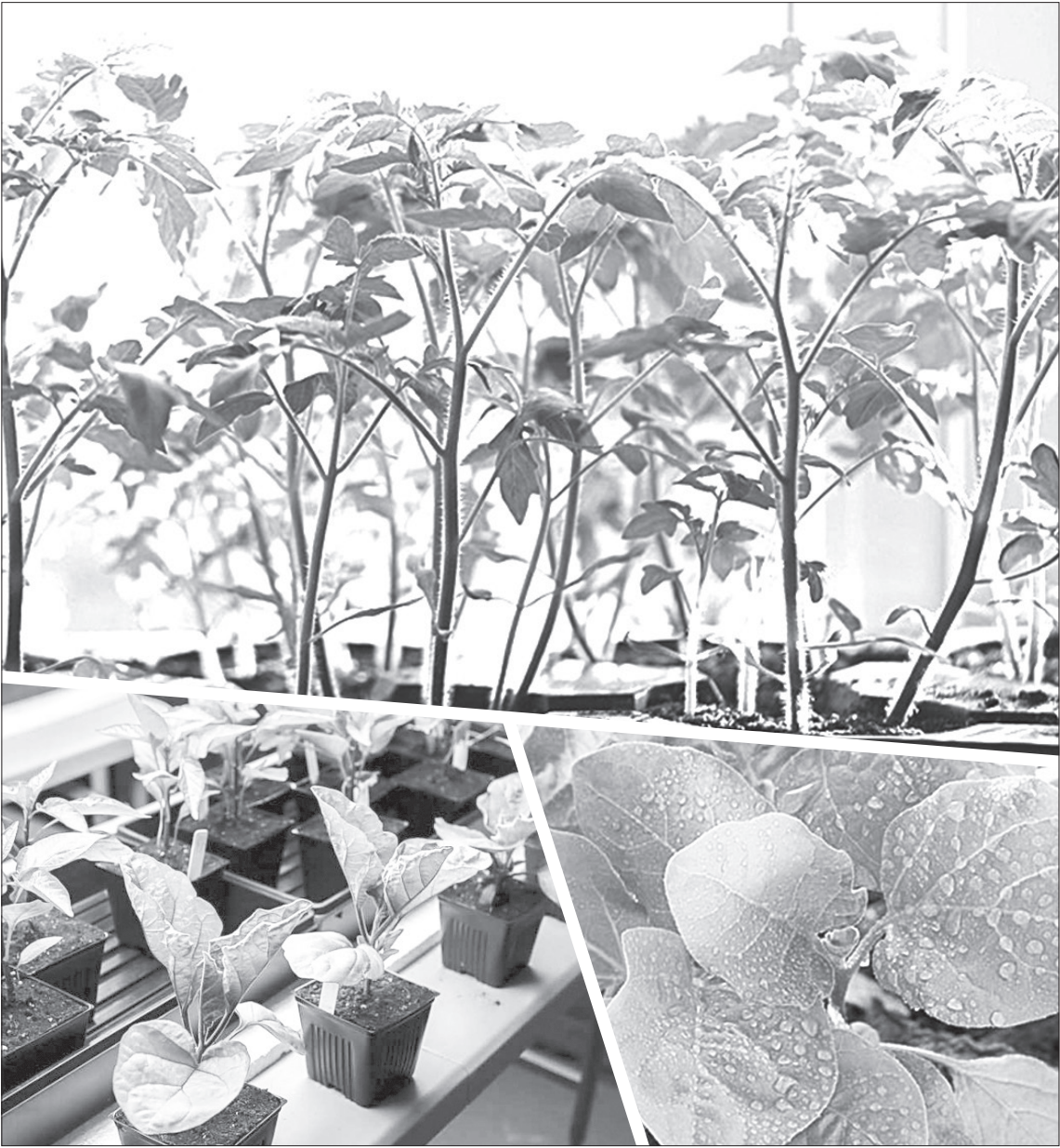
Март - крайний срок для посева семян на рассаду

■ Отбираем и выбраковываем мелкие, дефектные семена. Дезинфицируем в 1% растворе марганцовки и обрабатываем стимуляторами роста. Семена