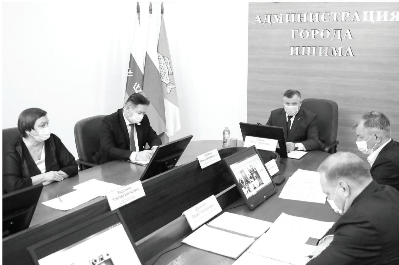
В ходе заседания глава города поставил задачу усилить контроль за соблюдением требований постановления правительства Тюменской области и управления Роспотребнадзора.

– Обстановка по заболеваемости очень сложная, – отметил Федор Борисович, – сегодня на лечении в многогоспиталях находятся почти 300 человек, 57 в отделении реанимации. Для формирования коллективного иммунитета необходимо привить 80 % населения города, сегодня вакцинированы 22587 ишимцев, или 57,84 процента. В последние дни жители города активизировались, стали более массово приходить на прививочные пункты.