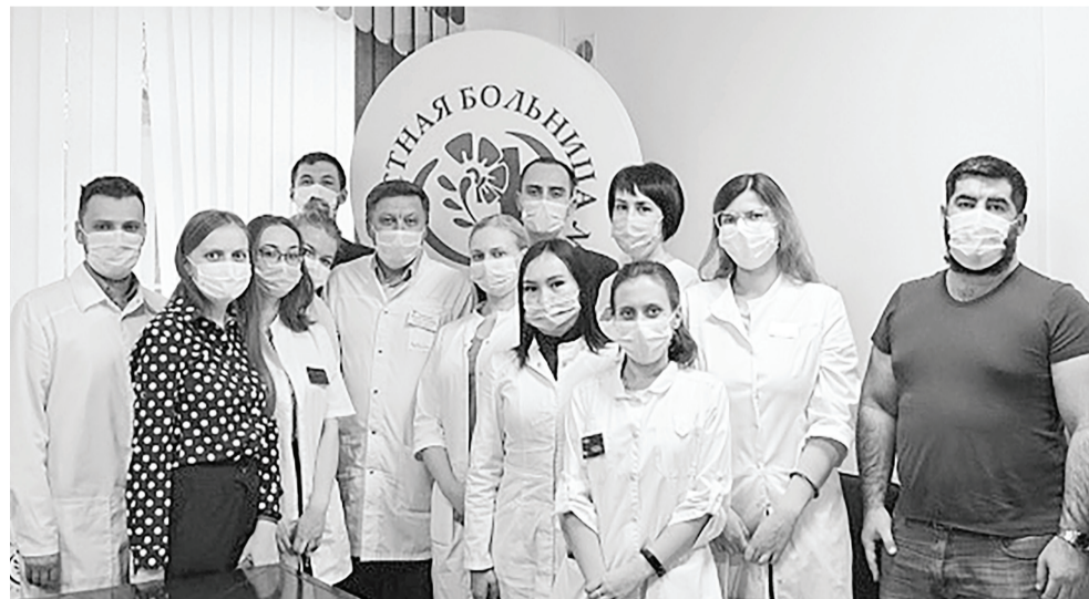
В 2021 году ряды медиков пополнились пятнадцатью докторами. Девять из них обучались по целевому набору, остальные самостоятельно выбрали ОБ № 4. Приехали на работу в медучреждение четыре семейные пары.

Жанна СТРИЖАК, пресс-служба ГБУЗ ТО «ОБ № 4» (Ишим).