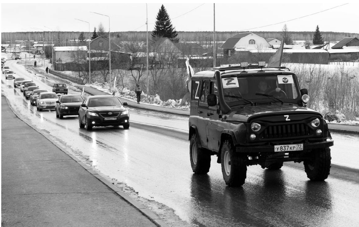
Колонна автомобилей с патриотической символикой проехала по улицам районного центра

В минувшую пятницу, 18 марта, в центре села Омутинское состоялся концерт-митинг «Наше будущее в наших руках», посвященный восьмой годовщине воссоединения Крыма и Севастополя с Россией.