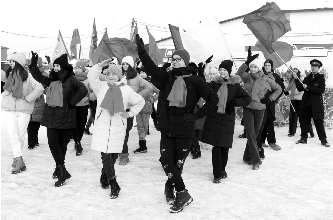
Участники ансамбля эстрадного танца «Мы молодые» проводят флешмоб «Мы за мир!»