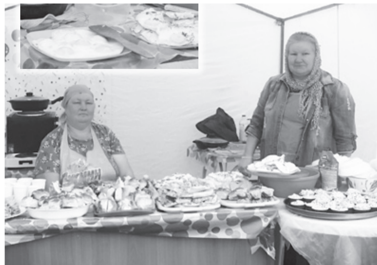
|| Фото из архива бархатовского ДК

Под навесом шатра повара готовили яичницу, глазунью и варили яйца. Также были угощения от жителей села. В честь 100-летия Исетского района организаторы фестиваля приготовили омлет из 100 яиц. Конечно, за раз всё не уместилось,