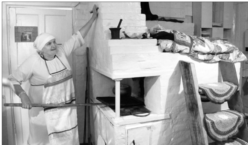
Мечи пироги из печи!