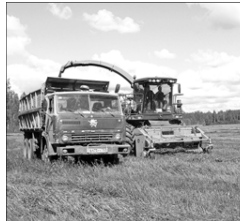
На полях хозяйства