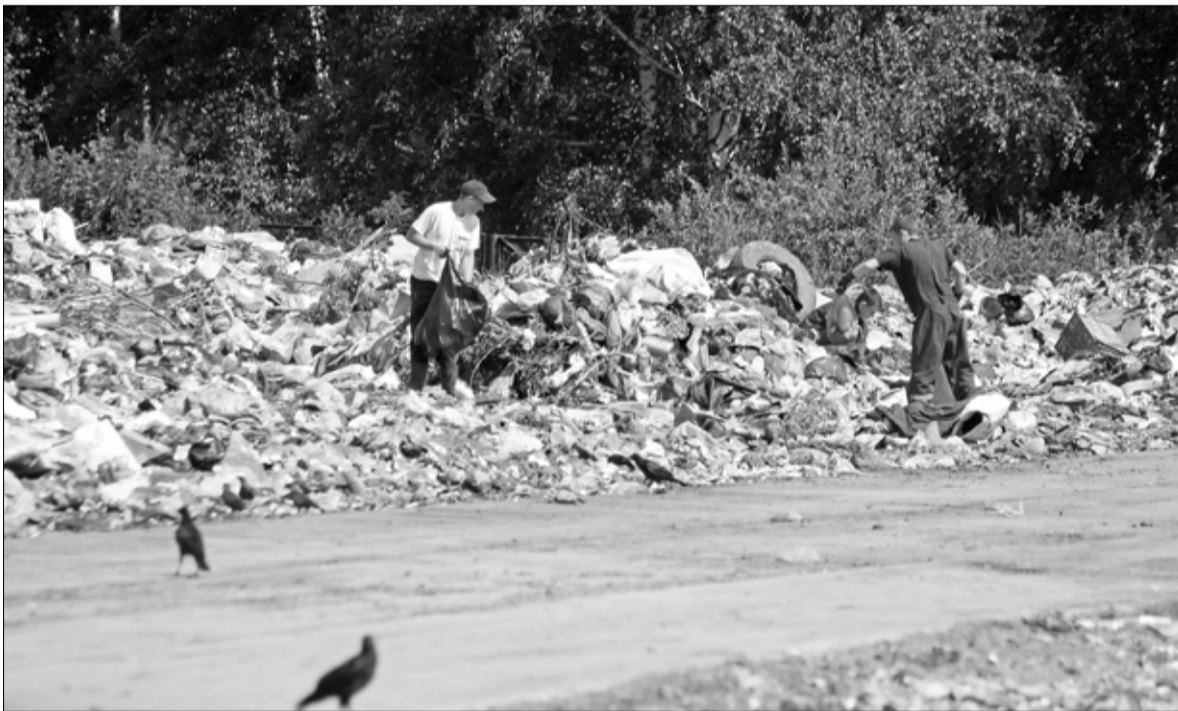
Ширятся горы мусора на поселковой свалке