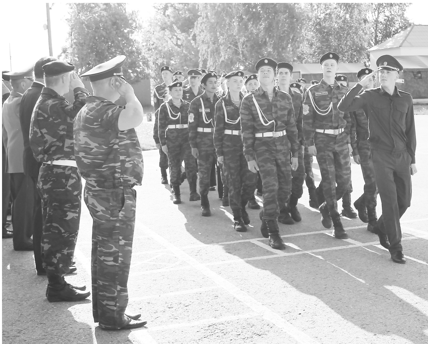
Приветствуя гостей, курсанты прошли торжественным маршем.