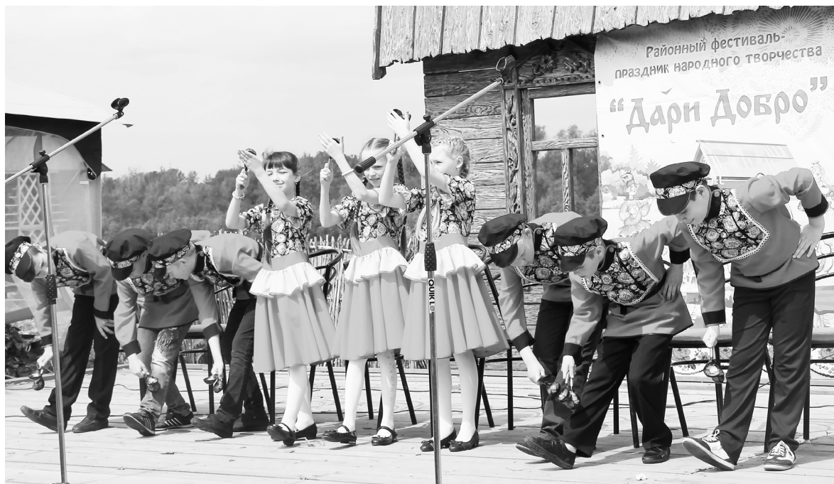
Ансамбль ложкарей — один из участников фестиваля «Дари добро».