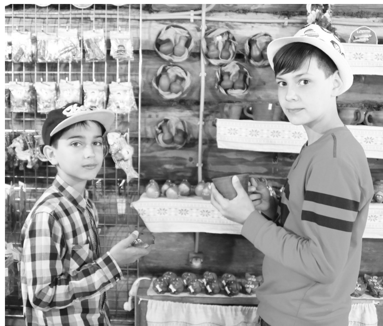
Юные посетители «подворья» заинтересовались гончарной мастерской: «Нам бы тоже хотелось научиться!».