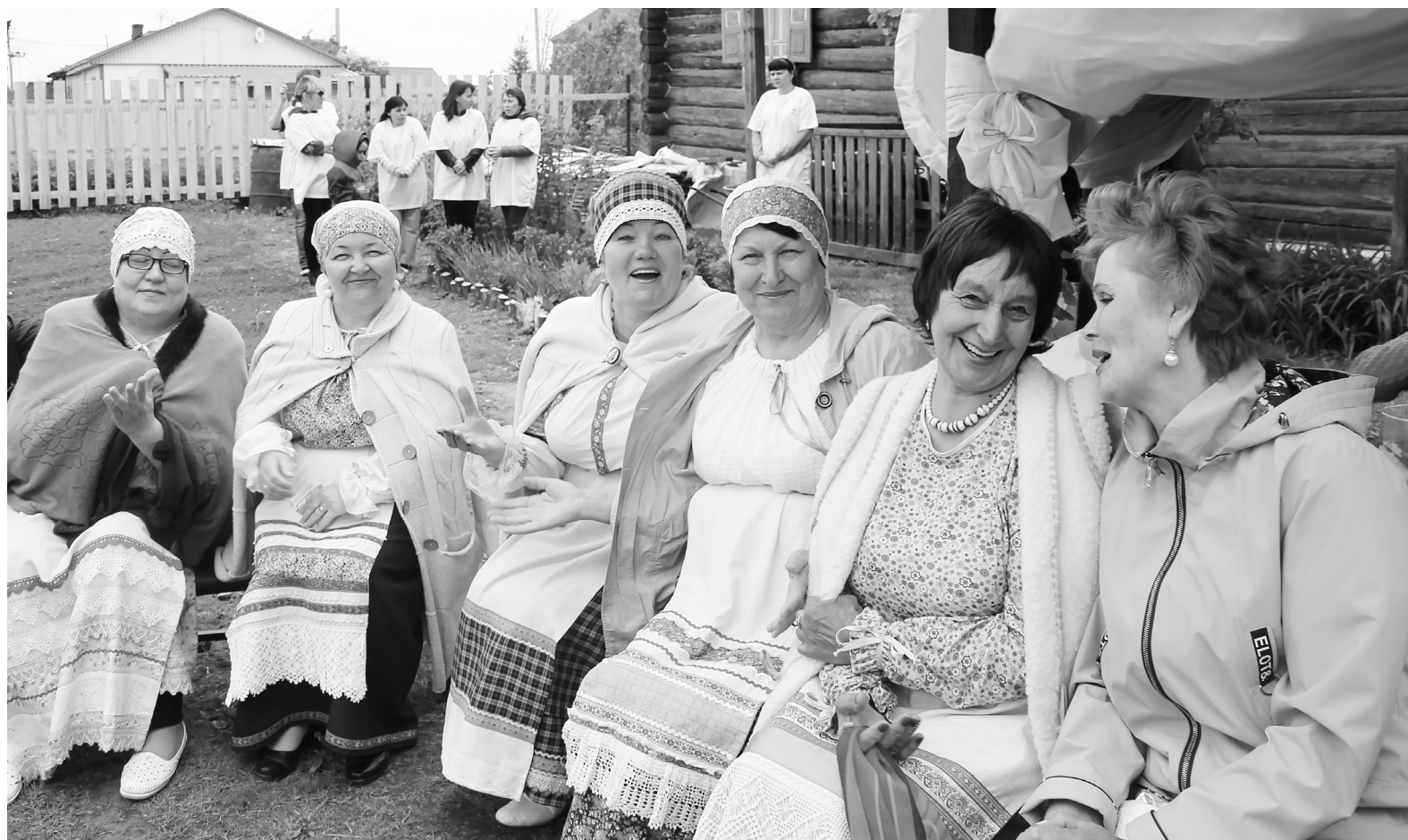
Деревенские посиделки коллектива ЦКиД в «Сибирском подворье».

«Сибирское подворье» — это живописная картинка, воспроизводящая быт, уклад жизни сибирской семьи. Подворье принадлежало богатой зажиточной семье Косыгиных, но не отличалось какой-то вычурностью. Простота быта всегда была от-