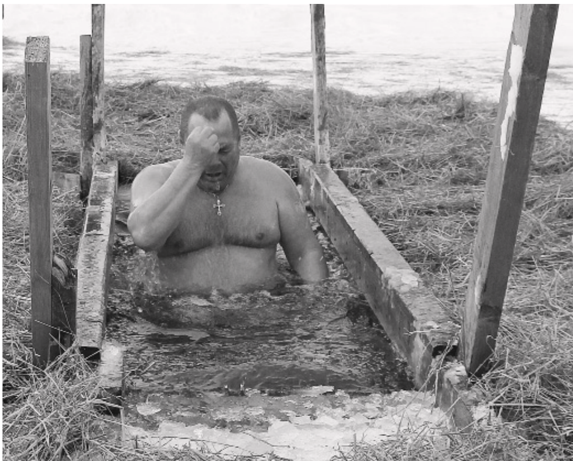
Таинство омовения – одно из главных моментов крещенского праздника.