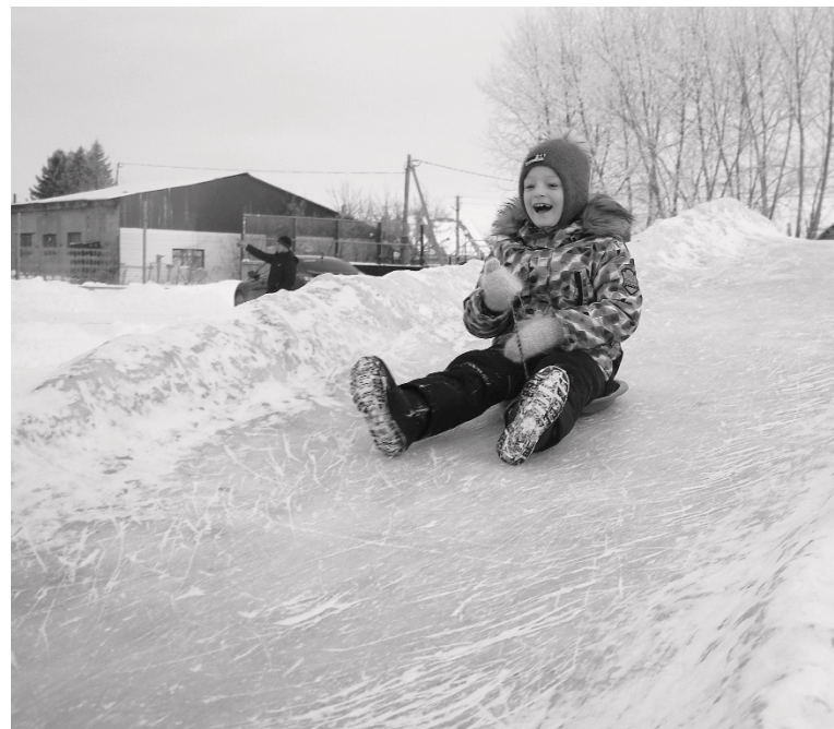
Для детворы зима без горки – не зима!