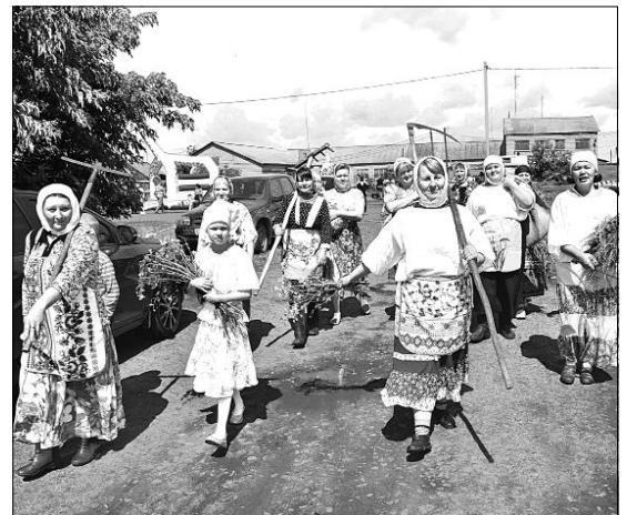
Так началась презентация зарословцев: женщины возвращаются с покоса домой.