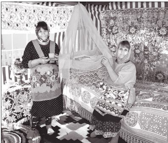
На сельских подворьях можно было и блюда попробовать, и сфотографироваться на память.