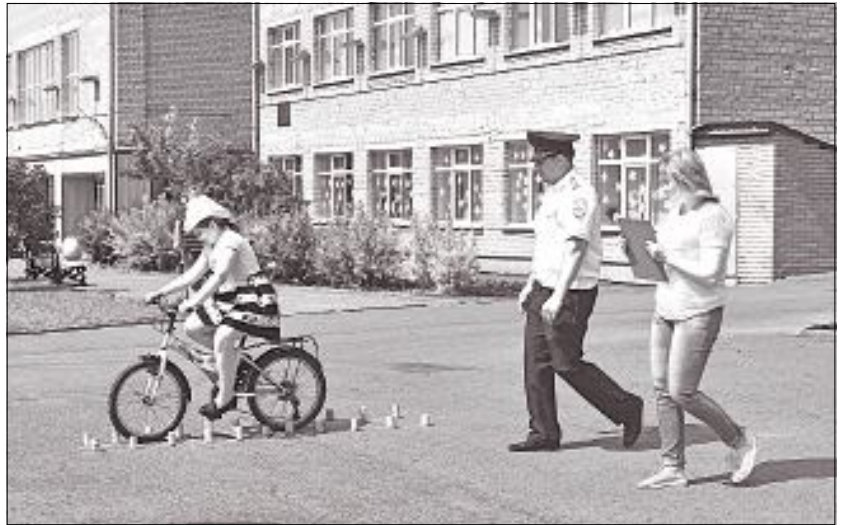
Главным заданием игры было «Фигурное вождение велосипеда».