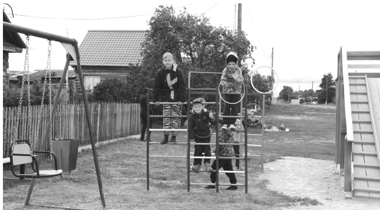
На новой игровой площадке в Медведево собирается много детворы с улиц Садовой, Молодёжной и Советской

Долго ржавели железные конструкции, что остались от старой детской площадки на улице Садовой в селе Медведево. Но жители близлежащих домов решили преобразить их.