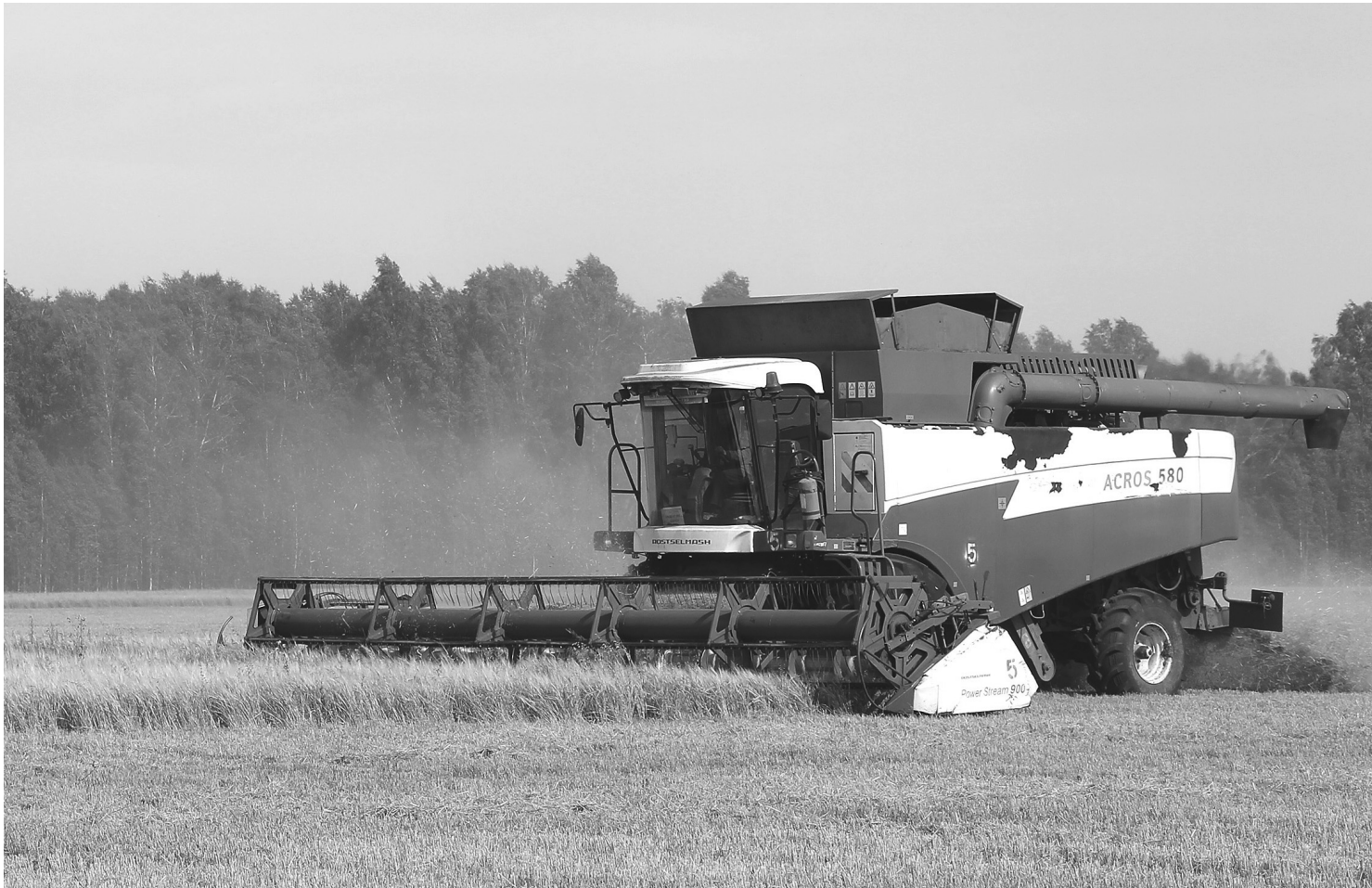
На Малышенском отделении сельхозпредприятия «Голышмановское» заняты 16 комбайнов, 11 из них работают напрямую, один косит на свал, два комбайна задействованы в качестве подборщика.