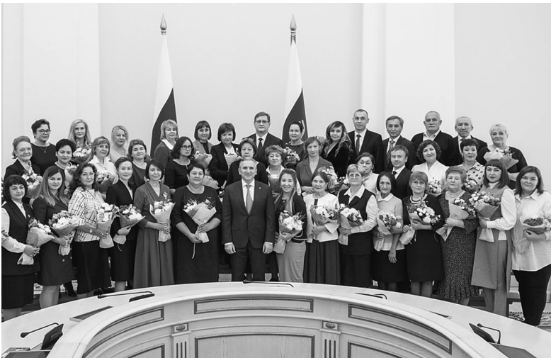
Глава региона Александр Моор с педагогами-победителями профессиональных конкурсов и теми, чьи ученики показали высокие результаты в интеллектуальных и творческих состязаниях

В День учителя губернатор Тюменской области Александр Моор торжественно вручил 45 педагогам ведомственные и региональные награды за добросовестный труд.