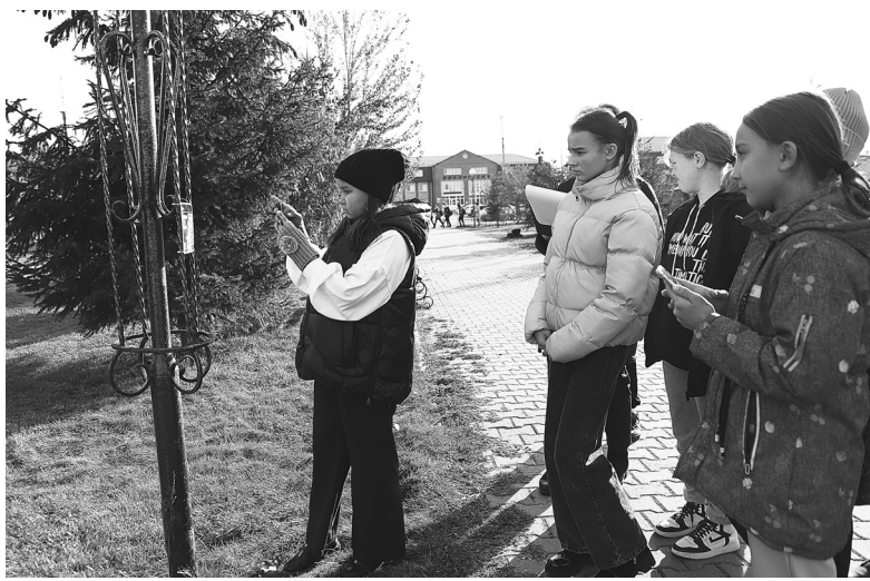
Сканируя QR-код, участники могут посмотреть видеозаписи, которая рассказывает о достопримечательностях посёлка Голышманово

«Мы покажем вам свой город» – этот краеведческий проект продолжает реализовывать инициативная группа школы № 2.