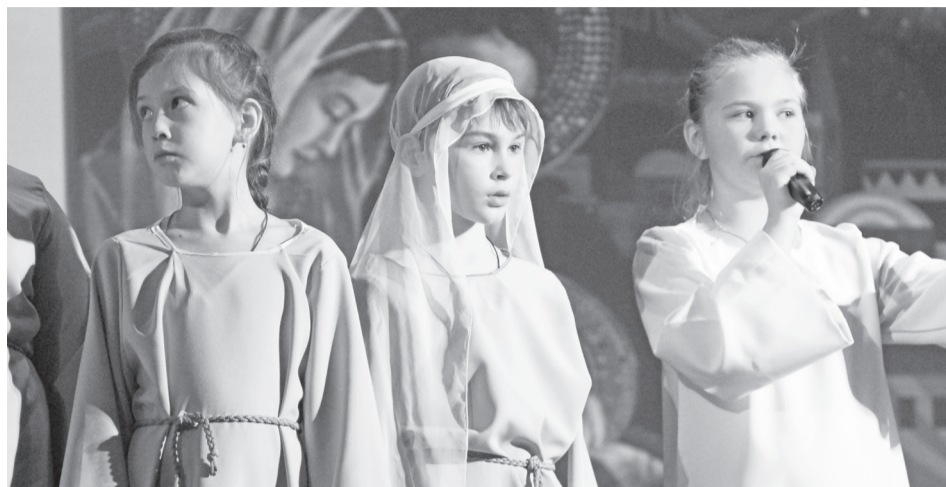
Фрагмент музыкально-театрализованного концерта учащихся центра «Троица».