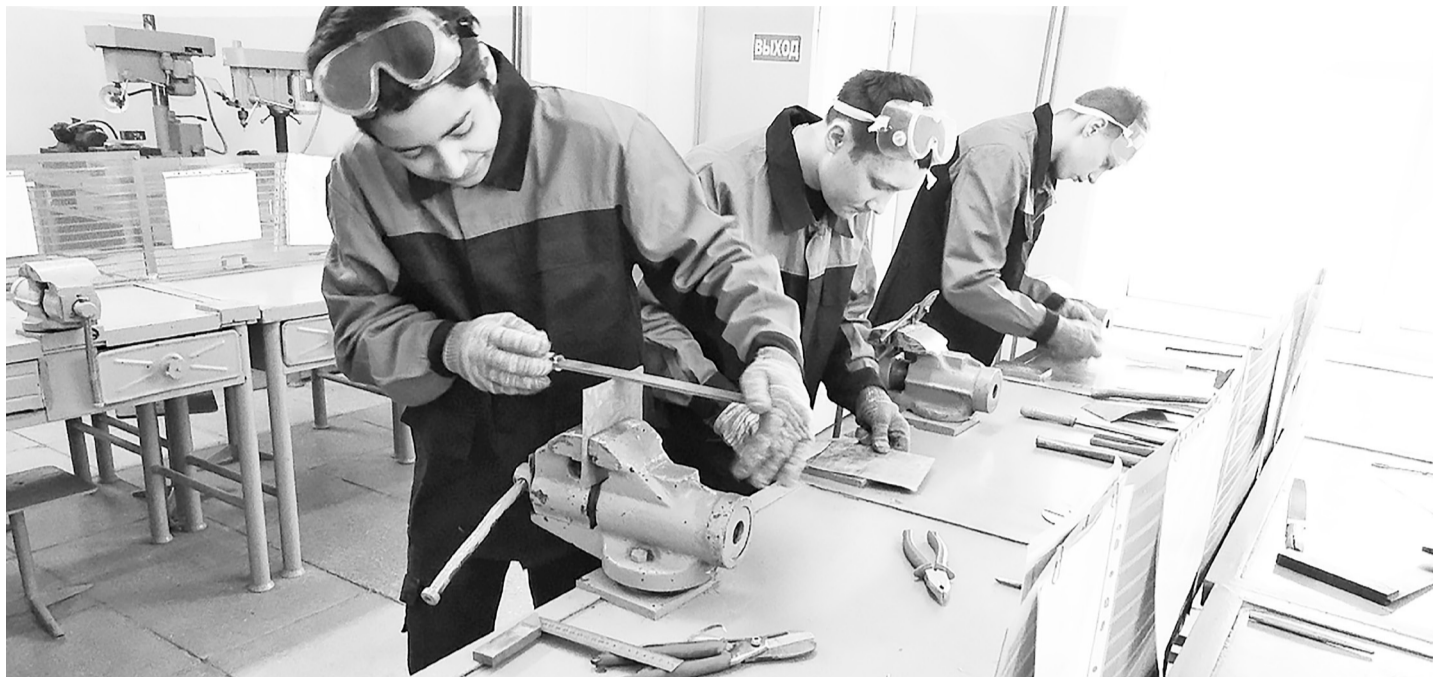
Первый день конкурса «Славим человека труда». Обучающиеся по направлению «Мастер слесарных работ» соревнуются в компетенции «Обработка листового металла».

Первого февраля в актовом зале агротехнологического колледжа состоялось торжественное открытие «Недели науки»