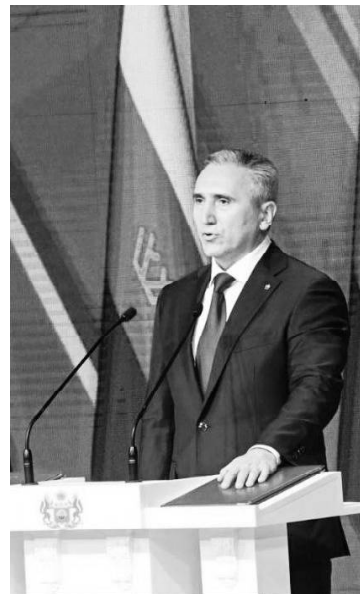
Александр Моор

15 сентября 2023 года Александр Моор вступил в должность губернатора Тюменской области. Глава региона принёс присягу на верность народу и Конституции РФ.