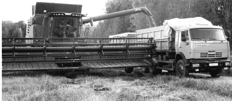
Комбайн сыпает зерно