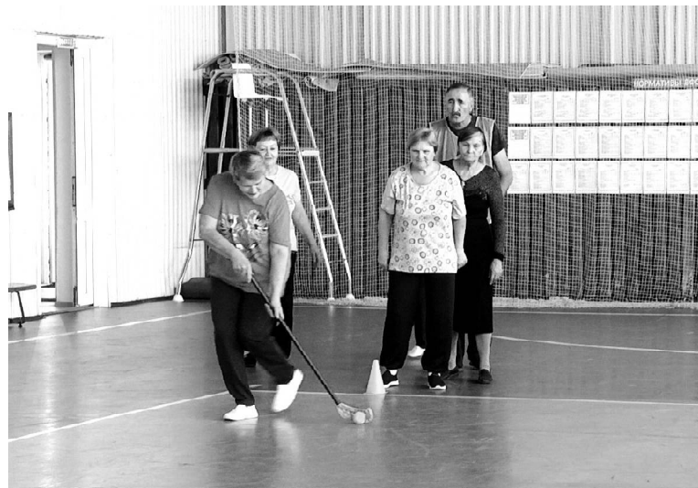
➤ «Весёлые старты»

15 сентября стартовала областная акция «Пусть осень жизни будет золотой». Она приурочена к Международному дню пожилых людей. По этому поводу на минувшей неделе состоялась встреча председателей первичных ветеранских организаций.