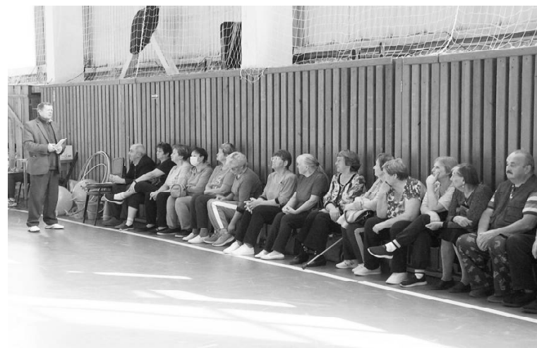
➤ Встреча с председателями «первичек» района

Встреча была необычной. Её провели не в формате совещания, а в свободной дружеской обстановке. Все собрались в спорткомплексе, и неслучайно. Старшее поколение ожидали «Весёлые старты». А вначале обсудили несколько важных вопросов. Обговорили, какие мероприятия и конкурсы будут проходить и в каких «первички» будут принимать участие. В 2025 году исполнится 80 лет со дня Победы в Великой Отечественной войне. Поэтому ветеранские организации должны провести важную работу по подготовке к 9 Мая и уделить особое внимание тем, кто ковал Победу, рискуя своей жизнью. Также присутствующих ознакомили с культурной программой, которая посвящена 1 октября. Так, в День пожилых людей в районном Доме культуры состоится праздничный концерт. Параллельно будут работать интерактивные площадки. 29 сентября для данной катего-