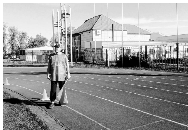
➤ «Кросс нации» в Викулово

На следующий день, 16 сентября, спортсмены из Викулово приняли участие в соревнованиях по бегу в Ишиме. Им были предложены следующие дистанции: 1, 4, 6, 10 километров.