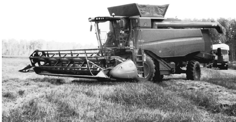
Снова в поле