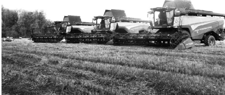
На отдыхе