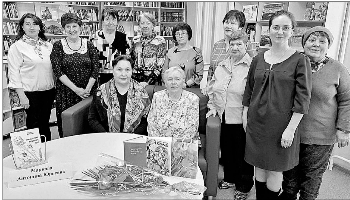
Участники встречи в Боровской сельской библиотеке.