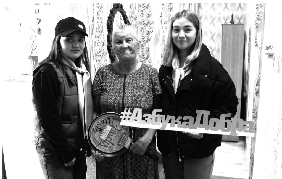
Пожелания пожилых людей были исполнены!

– Мы рады, что с каждым годом у нас появляется всё больше единомышленников, которые готовы на мгновение стать волшебниками, и признательны всем участникам акции, проявившим неравнодушное отношение к гражданам пожилого возраста. Желания пожилых людей ведь не очень-то и притязательны, это обыкновенные и простые хозяйственные вещи (кастрюли, сковороды, электрические чайники, постельное бельё, утюги, цифровая приставка