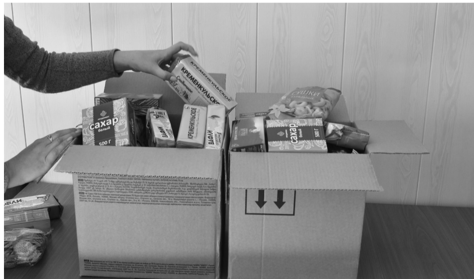
На следующей неделе пройдут отправки гуманитарной помощи