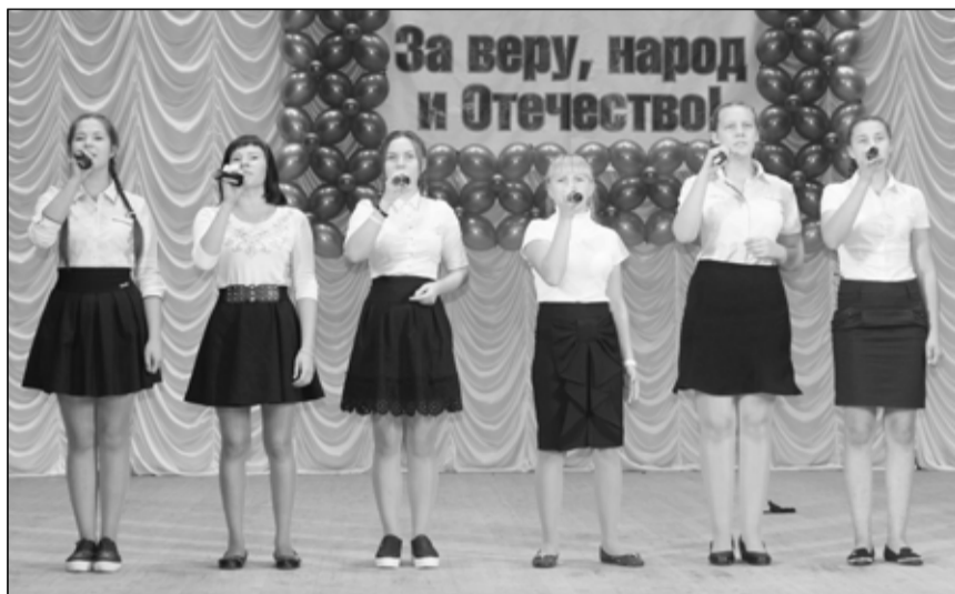
Выступление учащихся из п. Ленинка было ритмичным и торжественным.

Четыре номинации, интересные и сложные песни, своеобразные манеры исполнения, новые голоса заставляли всех присутствующих в зале зрителей внимательно слушать и чаще подпевать. Атмосфера уважения к приуроченной к мероприятию дате царил в воздухе. Каждый участник был хорош по-своему, все выступления были запоминающимися. Приятно было наблюдать за выступлениями земляков, волноваться вместе с ними. Чувствовалась большая заслуга специалистов, так замечательно подготовивших своих артистов на местах. По результату конкурса были подведены итоги.