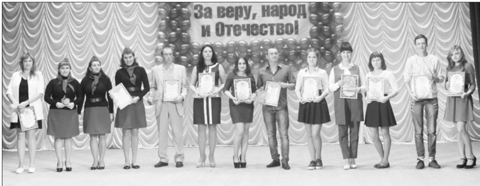
Награды нашли своих победителей! Трудно было сдерживать эмоции!