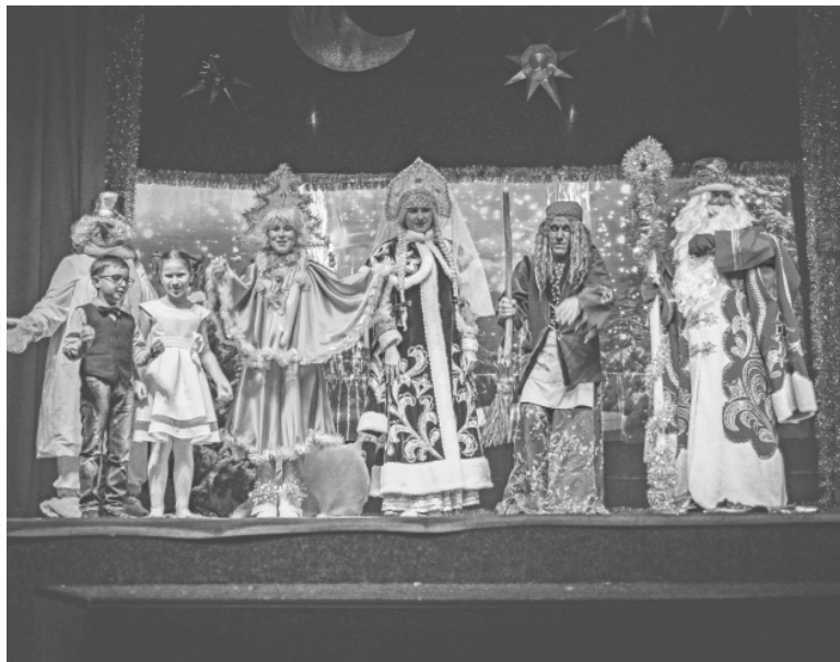
* Волшебное представление на сцене понравилось и взрослым, и детям.

После представления все зрители были приглашены на