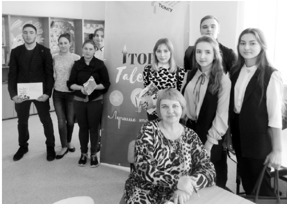
Представители учебных заведений готовы рассказать о своих будущих профессиях.