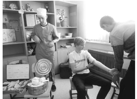
Студенты медколледжа продемонстрировали профессиональные навыки на практике.

Центр занятости населения Бердюжского района занимается не только трудоустройством безработных граждан, но и профориентационной работой среди выпускников школ.