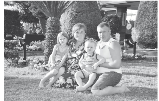
«Портрет на фоне лета».