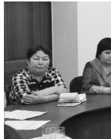
Общественный совет работает в тесном контакте с населением. На этот раз в обсуждении коммунальных проблем принимают активное участие старшие многоквартирных домов.

мо в ТРИЦ, и в текущем месяце эта строка будет изменена на «Обслуживание инженерных систем». Объясню почему. Наше предприятие не имеет права заниматься содержанием и обслуживанием мест общего пользования, так как не являет-