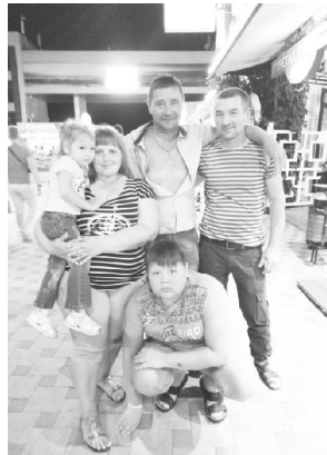
«Портрет на фоне лета».

С братом встретился б едва ли, Но удача помогла отдохнуть, на море съездишь, И с родными нас свела!