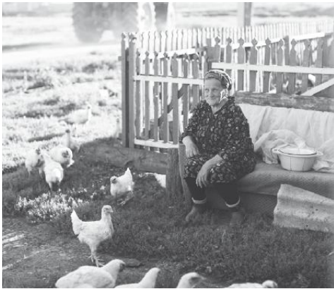
«Портрет на фоне лета»

Столько тепла и добра ты дала! Всегда укрывала от горя и зла. Спасибо, бабуля, за то, что ты есть. Твоей доброты не измерить, не честь!