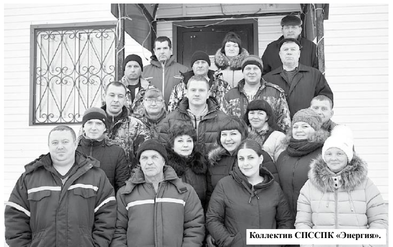
Коллектив СПССПК «Энергия».

-Конкурс этот проводится ежегодно, - продолжает моя собеседница, - для участия в нем мы должны были вновь представить документы за последние три года, при этом учитывались такие показатели, как рентабельность предприятия, объем производимой продукции, количество работников, рост заработной платы. По всем этим пока-