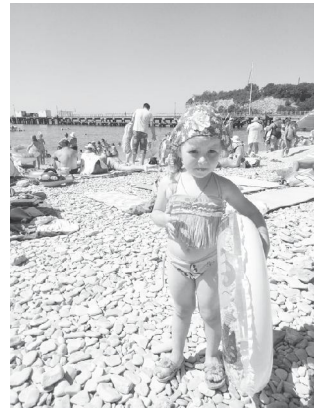
«Портрет на фоне лета».

Я на море побывала И мелуз там увидела. Я по камушкам гуляла И здоровье укрепляла.