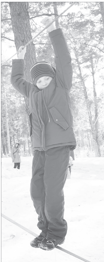
«Параллельный маятник» - не сложное, но интересное задание, под силу даже начинающим туристам