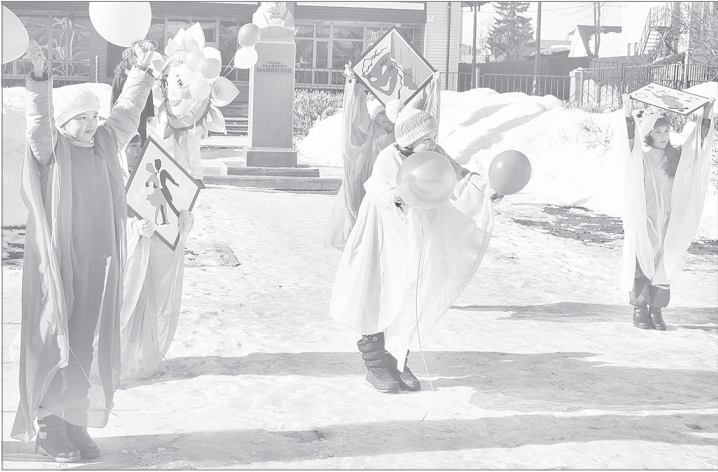
Все «музы» вышли к зрителям