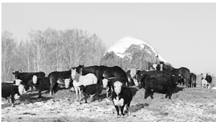
На ферме ИП «Маслов С.Н.». Фото С. Васюковича

Пресс-служба губернатора Тюменской области