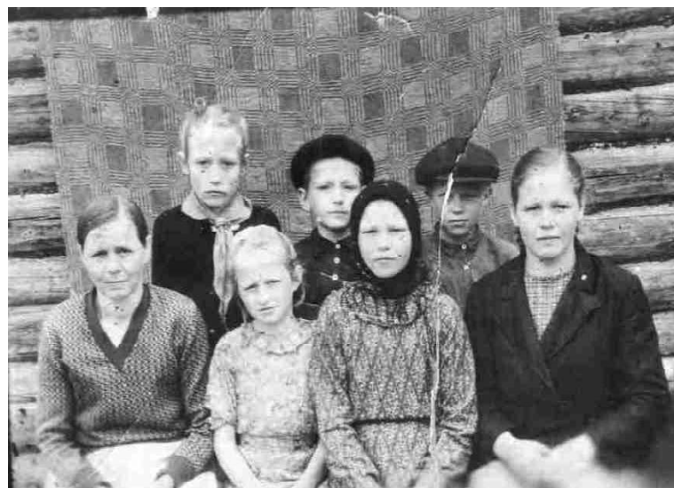
Жители д. Аксёнова, 1950 г.