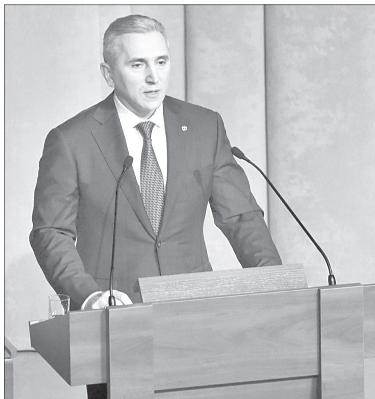
В своем первом послании губернатор рассказал о положении дел в регионе и задачах на будущее

Ключевые моменты послания Александра Моора