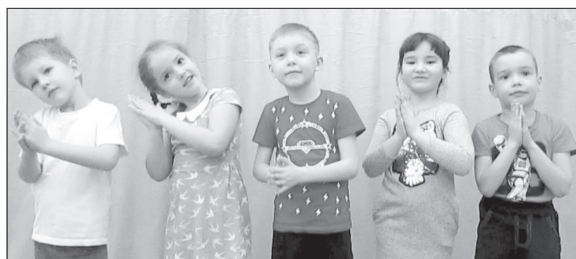
Своих мам поздравляют воспитанники структурного подразделения детсада № 5