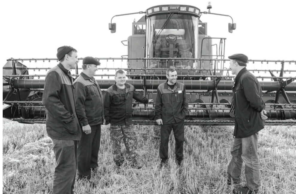
Ишимские хлеборобы снова получили самый большой урожай в области. //Фото Василия БАРАНОВА.

– В апреле на территории Ишимского района открылись шесть новых модульных фельдшерско-акушерских пунктов в селах Пахомово, Синицыно, Клепиково, Савино, Бутусово, Малоудалово. Работы по строительству, а также закупка медицинского оборудования и мебели