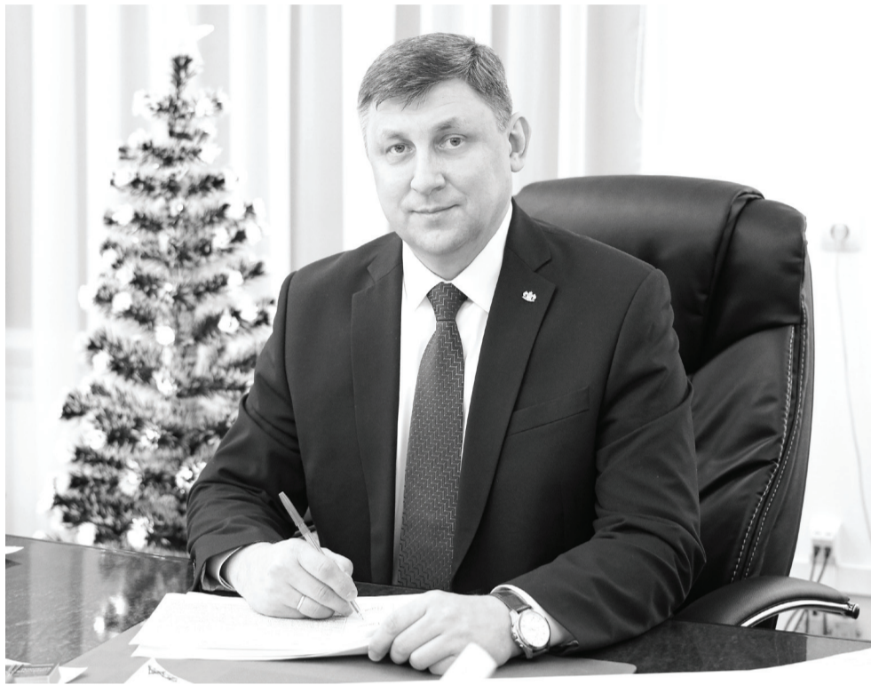
Глава Ишимского муниципального района по традиции подвёл итоги уходящего года.

– Предприятия животноводства также не сдают своих позиций: объем производства мяса за 10 месяцев 2021 года составил 17 тысяч тонн, молока – почти 9 тысяч тонн. Приростом основных производственных показателей радует ЗАО «Песьяновское». Начиная с середины 2020 го-