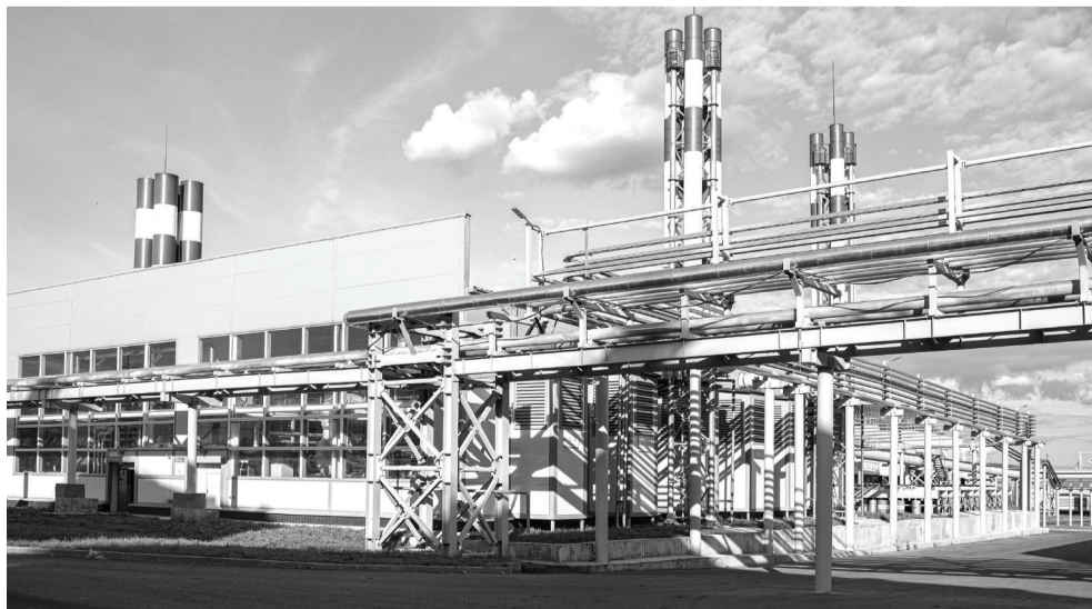
В АО «Аминсиб» внедрена уникальная технология глубокой переработки зерна.

Трудоустроены три участковых врача-терапевта, двое – в Ларихинскую участковую больницу, один – по программе «Земский доктор» в Плешковскую врачебную амбулаторию. Приняты на работу в ФАПы одиннадцать медицинских работников (средний персонал), в Первопесьяновскую врачебную амбулаторию – три человека.