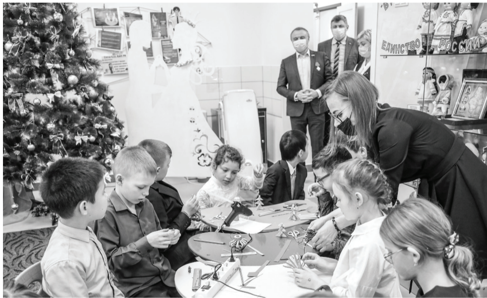
Мы гордимся достижениями ишимских селян в образовании, культуре и спорте.

– Пока летом ребята отдыхают, набираются сил, в образовательных учреждениях проходят ремонты,