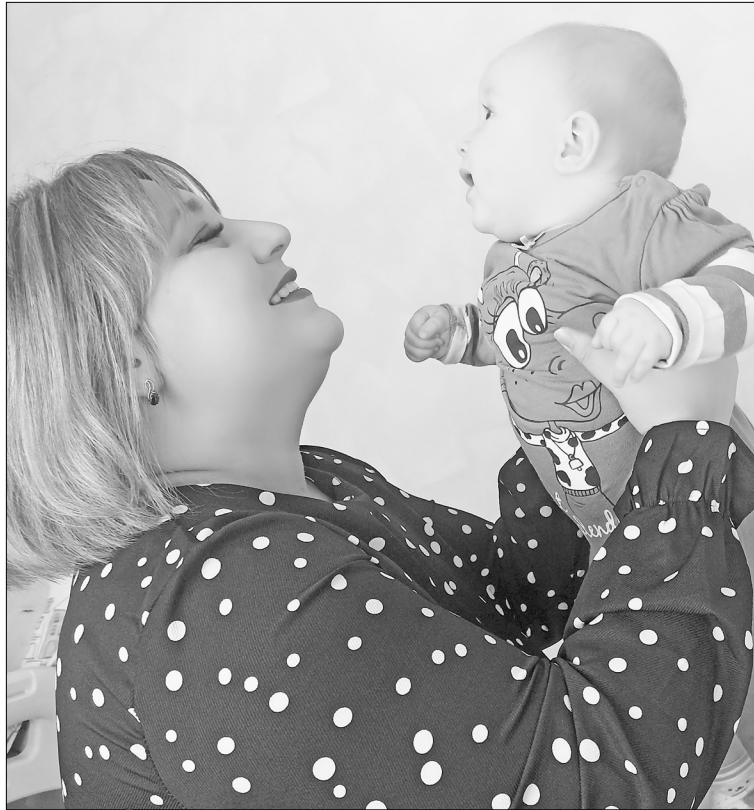
Счастливая женская половина семьи Шишкиных.

ты дни занимается мужскими делами по дому, а также вместе с сыновьями ездят на