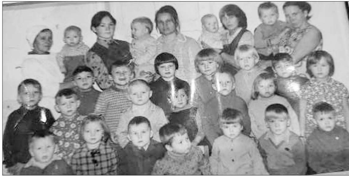
Антипинский детский сад-ясли и коллектив воспитателей.