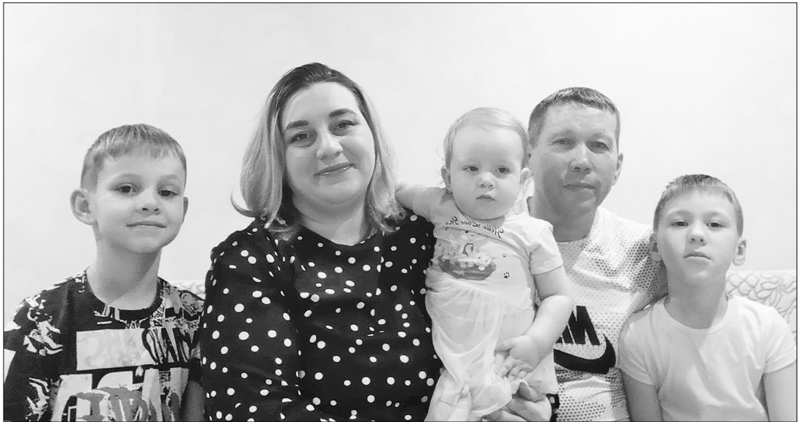
Семья Шишкиных в полном составе.