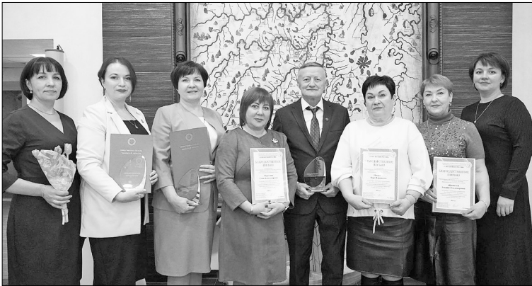
Самых активных участников Союза женщин России ожидали достойные награды.

По программе газификации подготовлены паспорта газификации на д. Казанку, Новоказанку, Ахманы и Ново-