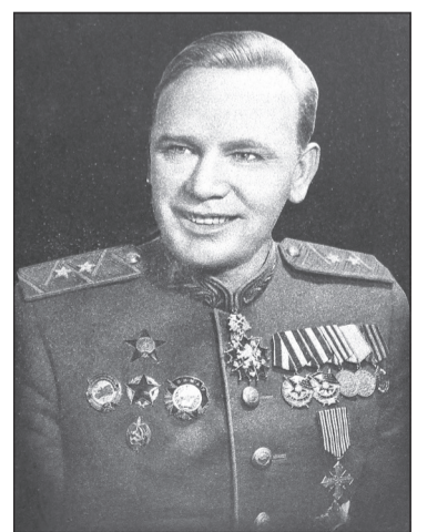
Павел Фитин вступил в комсомол в 1922 г.

Попав в опалу в возрасте 46-ти лет, Фитин в звании генерал-лейтенанта был отправлен в отставку по служебному несоответствию. Затем работал в Комитете госконтроля при Совете министров СССР, возглавлял фотокомбинат советского Общества дружбы и культурных связей с зарубежными странами. Умер в 1971 году. Награжден двумя орденами Красного Знамени, орденом Красной Звезды, орденом Красного Знамени Тувы.