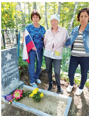
► Июль 2022 г., памятник М.В. Алданову

на сельских кладбищах. Чтобы вызвать у детей интерес к истории своего рода. А ещё чтобы они и в дальнейшем помогали «серебряным» волонтерам ухаживать за обновлёнными могилами и высаженными на них цветами.