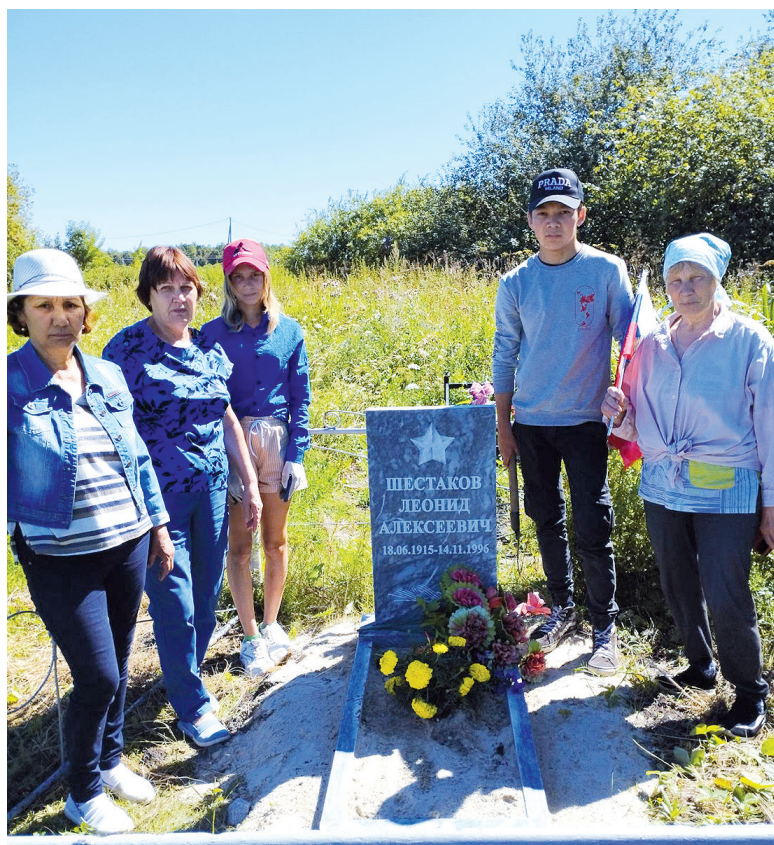
► Июль 2022 г., памятник Л.А. Шестакову

Одной из задач проекта было участие в нём «серебряных» волонтеров и волонтеров-школьников с тем, чтобы старшее поколение познакомилось с историей нашей страны, людьми, жившими рядом, защитниками Отечества, похороненными