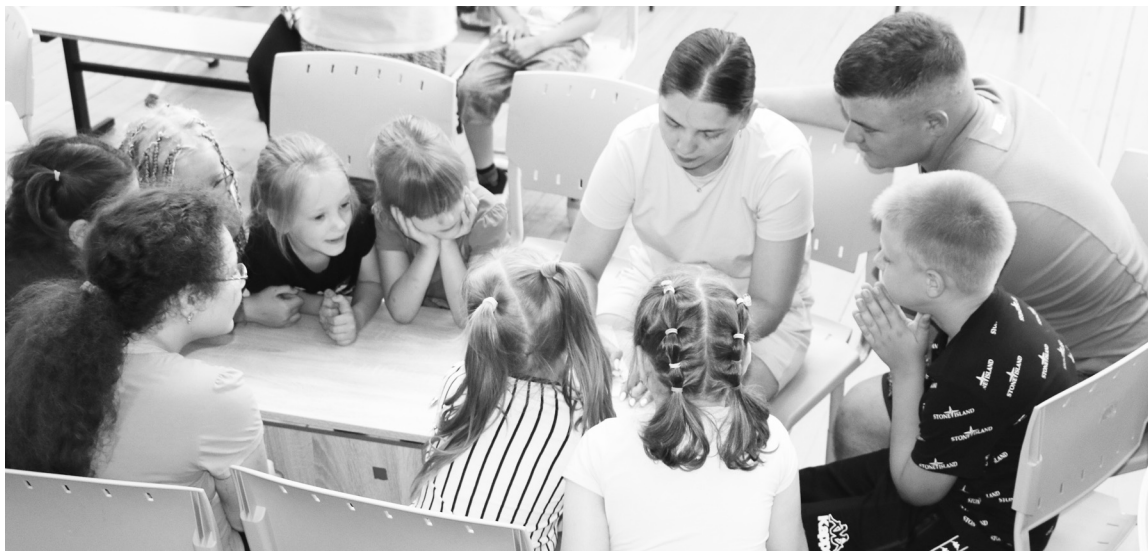
|| Участники квиза «СуперСемейка» отвечают на вопросы.

Особая программа прошла для отдыхающих в День семьи, любви и верности: специалист Молодёжного центра Елена Зотова провела интеллектуальный интерактивный квиз «СуперСемейка», к которому