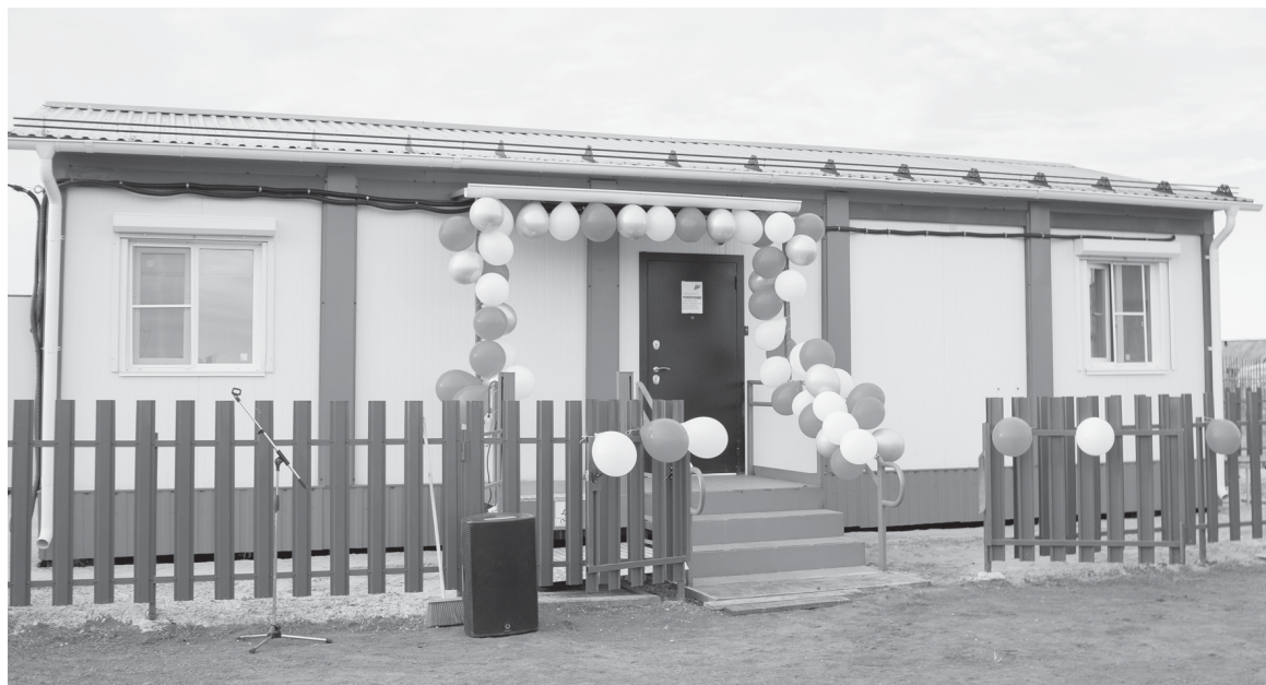
Площадь нового медучреждения больше прежнего в два раза