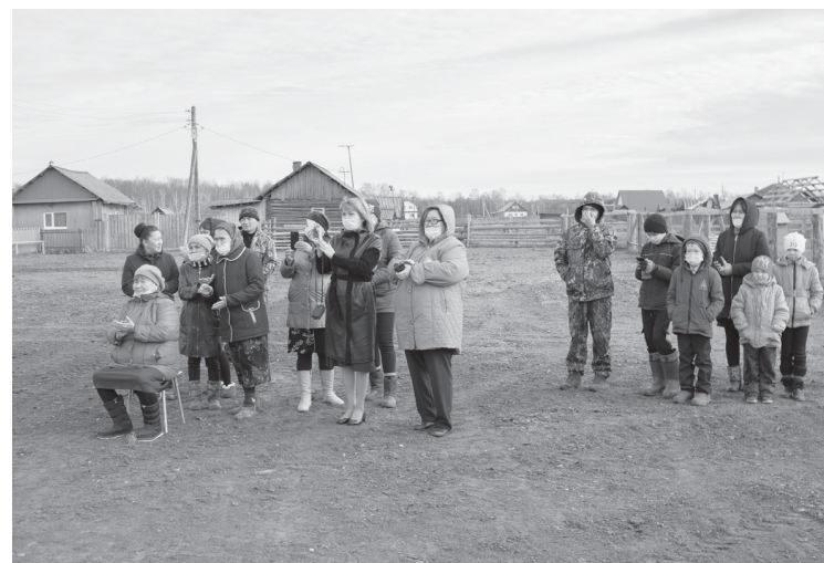
Открытие ФАПа стало большим событием для жителей Старого Каишкуля