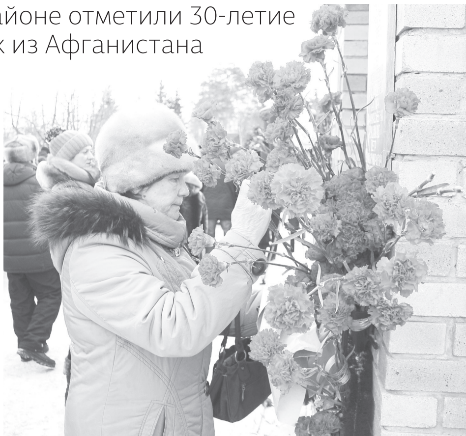
Ежегодно 15 февраля к мемориалу несут сотни гвоздик в память о тех, кто не вернулся из горячих точек