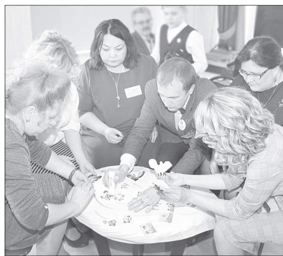
Номинанты «Учитель года» создают модель выпускника детского сада