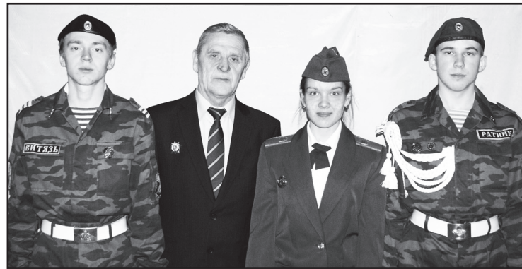
Участники военно-патриотического образовательного слёта