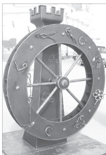
Вес нового арт-объекта составляет более 300 кг

Официальный старт фестивалю дал глава города Вячеслав Смелик.