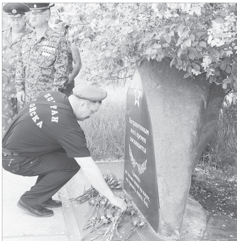
Цветы к памятнику пограничников всех времен, установленному в 2015 году по инициативе ялуторовских ветеранов погранслужбы