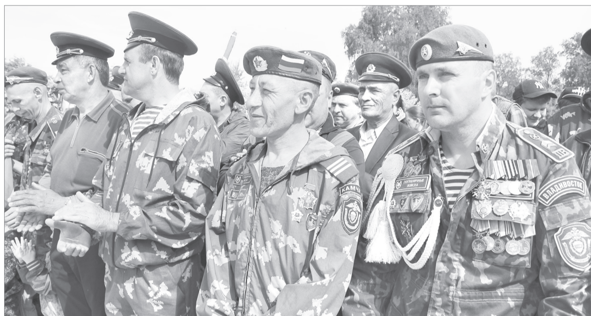
В Ялуторовске сегодня проживает более ста пограничников