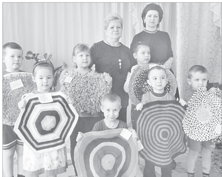
Ребятишки из детского сада № 10 тоже поучаствовали в акции