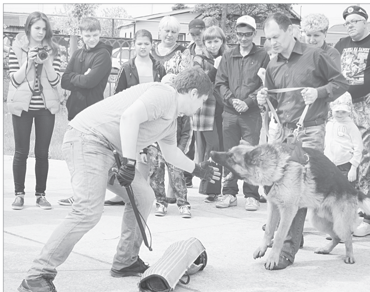
Всего в клубе «Артс» 50 собак, из которых сорок - служебные